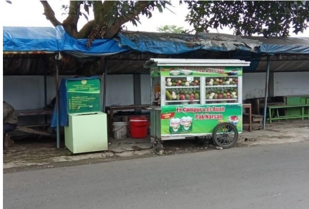
Foto lokasi Penelitian