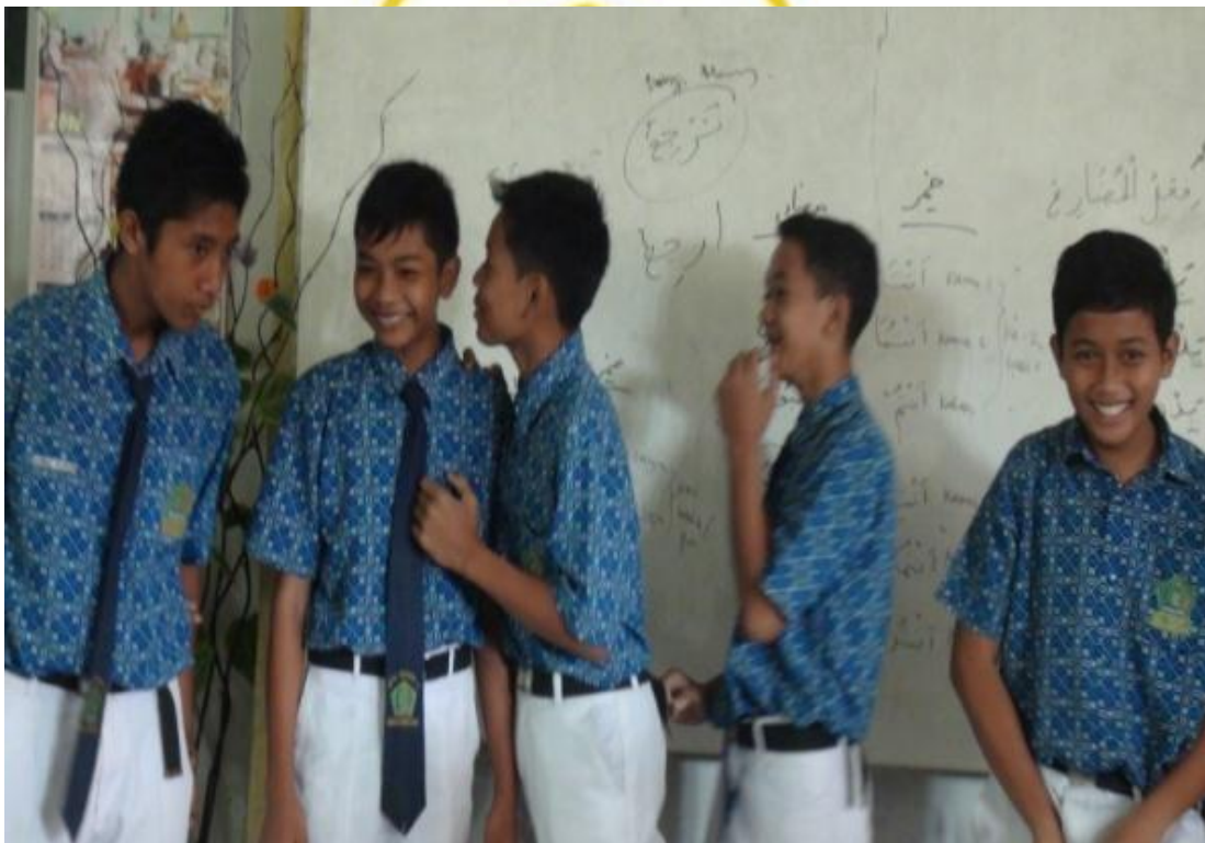
Siswa laki-laki melakukan strategi bisik berantai, 28 April 2016