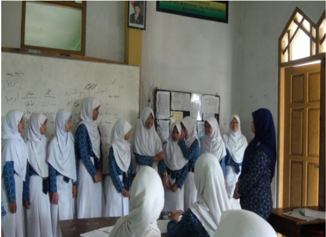
Siswa perempuan melakukan strategi bisik berantai, 28 April 2016