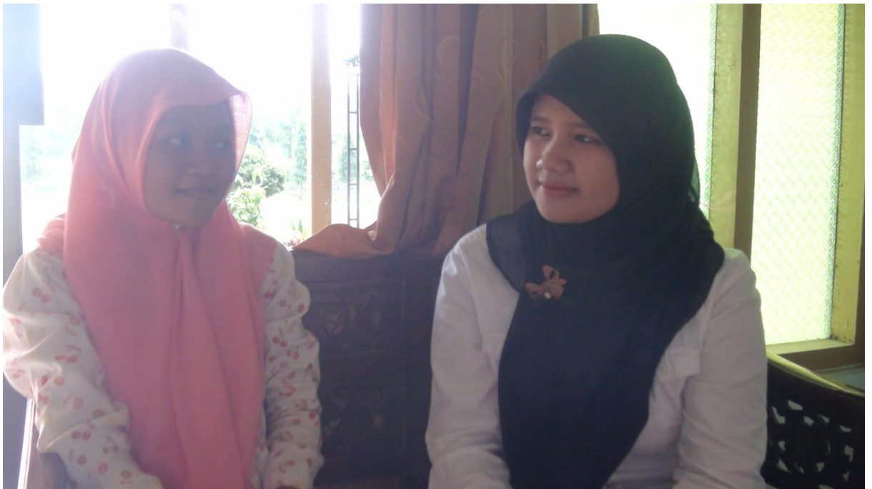
Setelah wawancara, peneliti berfoto dengan guru bahasa Arab, 29 April 2016