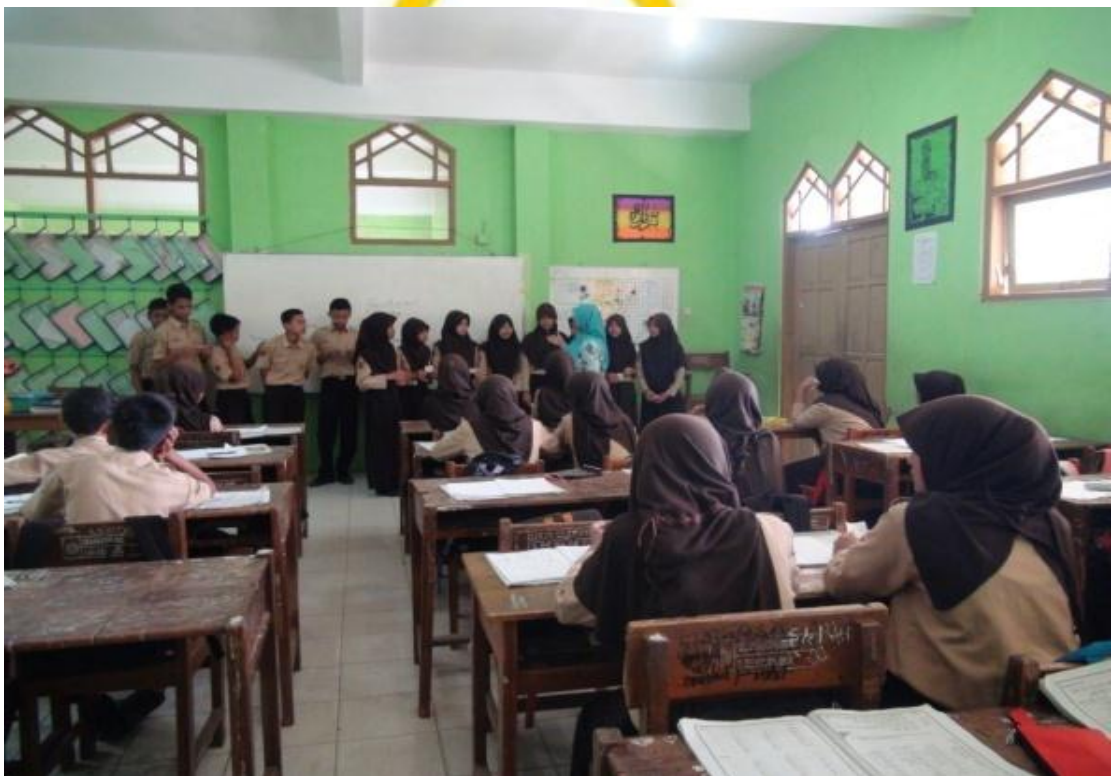
Masing-masing siswa membacakan jawaban sesuai kartu yang dipegangnya, 22 April 2016