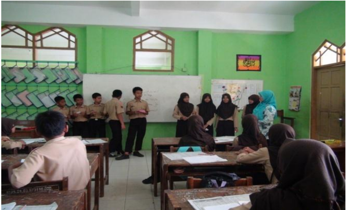
Siswa yang merasa jawabannya adalah kartu miliknya maju, 22 April 2016