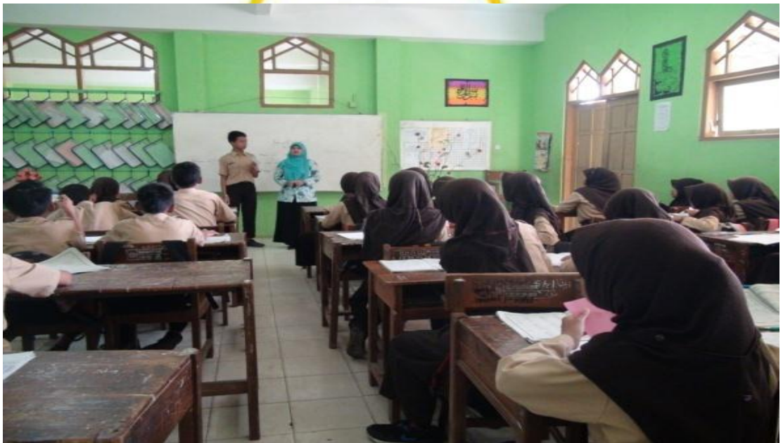
Siswa yang mendapat kartu pertanyaan maju ke depan, 22 April 2016