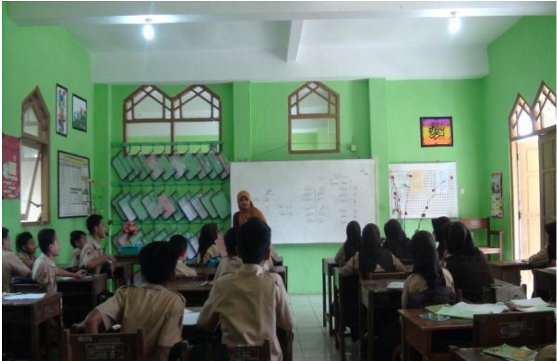
Guru menanyakan jumlah kosa kata yang didapat, 29 April 2016