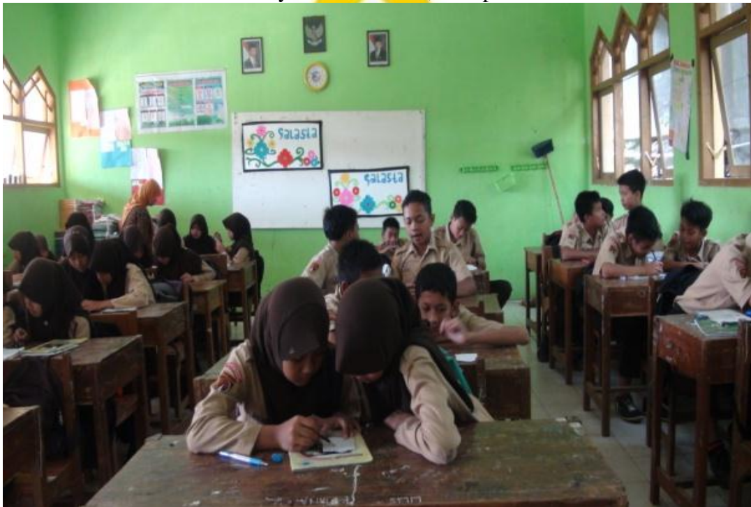
Siswa dengan teman sebangkunya bekerja sama mencari kosa kata, 29 April 2016