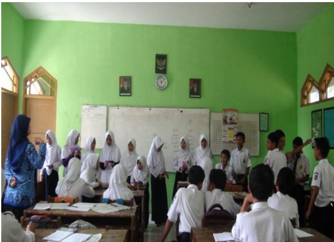
Perwakilan kelompok akan mempresentasikan hasil menjodohkannya, 2 Mei 2016