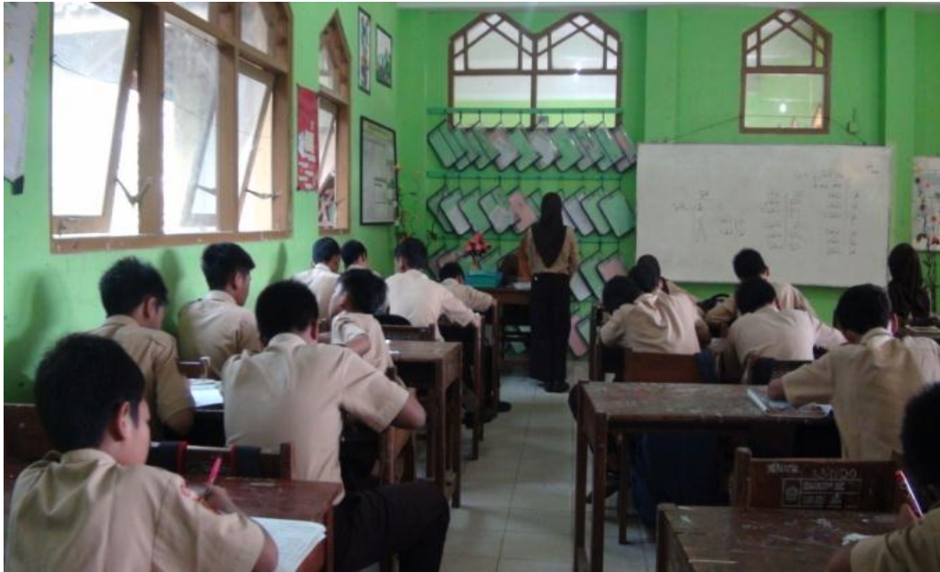
Siswa menyetorkan hafalan, 28 April 2016