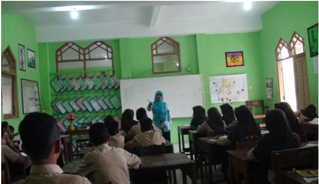
Guru melakukan tanya jawab terkait materi, 22 April 2016