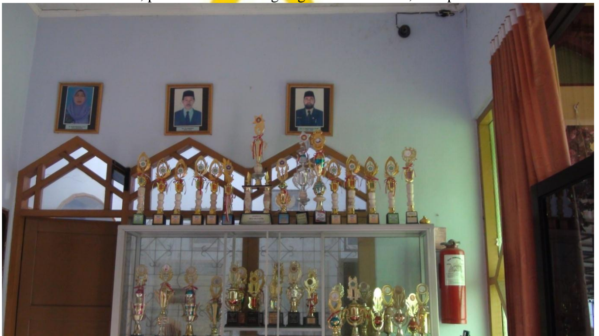
Bukti prestasi di MTs N 2 Banjarnegara, 29 April 2016