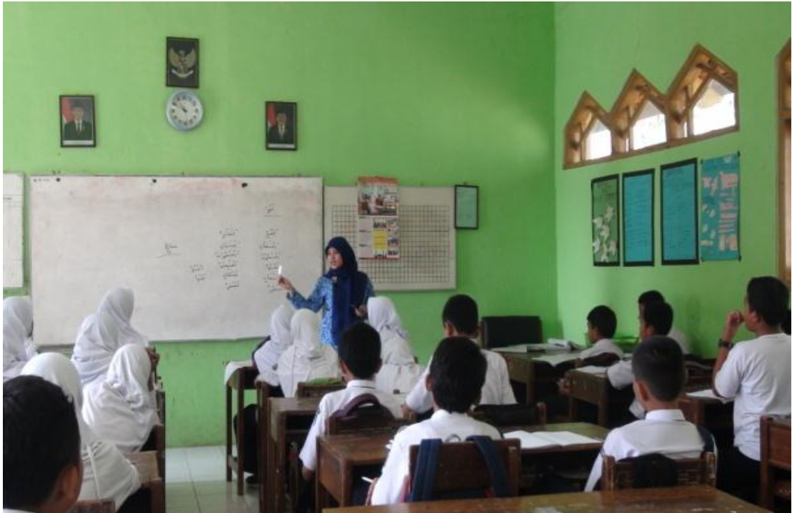
Guru memberikan petunjuk permainan, 2 Mei 2016