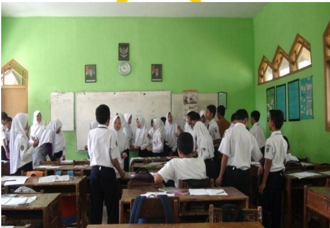
Siswa mencari pasangan kartunya, 2 Mei 2016