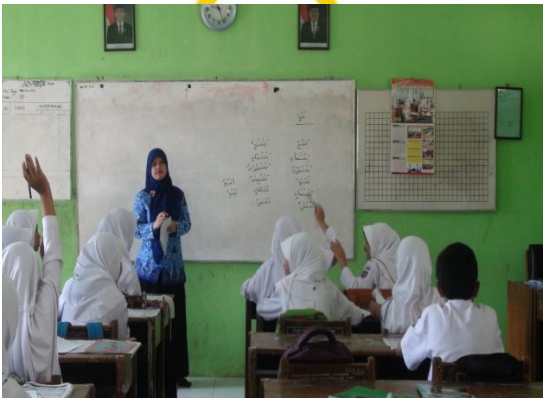
Siswa mengacungkan jari untuk bertanya, 2 Mei 2016