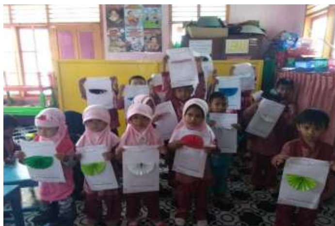
Gambar 4.2 kegiatan anak dalam kelas

Selanjutnya ambil ujung kanan-bawah, lipat ke arah kiri-atas membentuk segitiga. 106