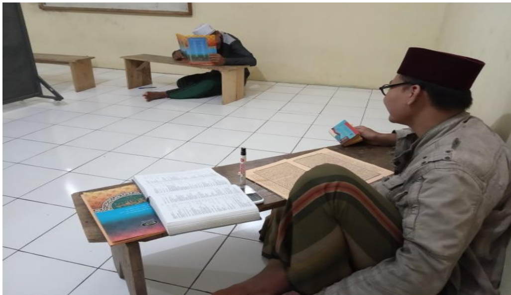
Seorang santri sedang membaca kitab fiqih