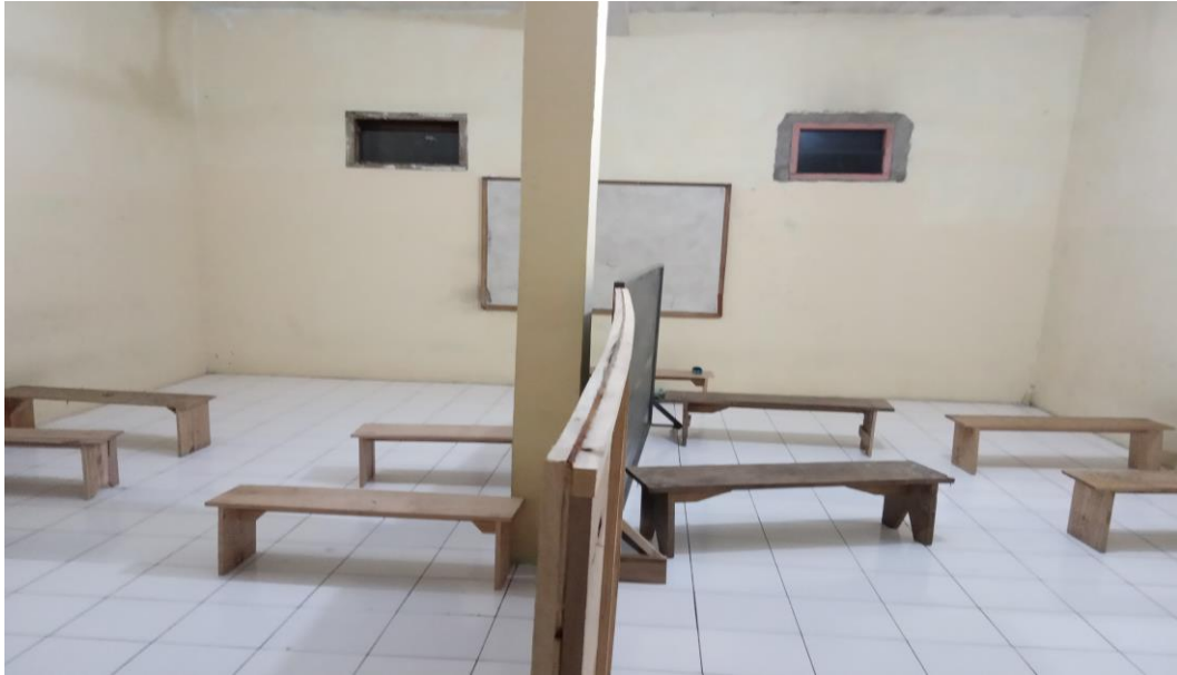
Ruang kelas pembelajaran