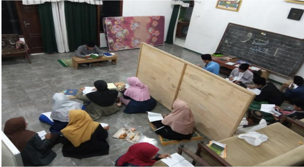
Pembelajaran pada malam hari