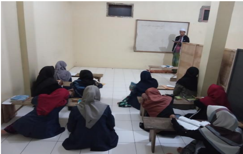
Pembelajaran pada pagi hari