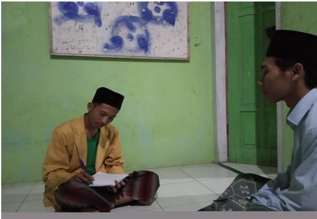
Wawancara dengan ustadz pengampu Alfiyyah Ibnu Malik