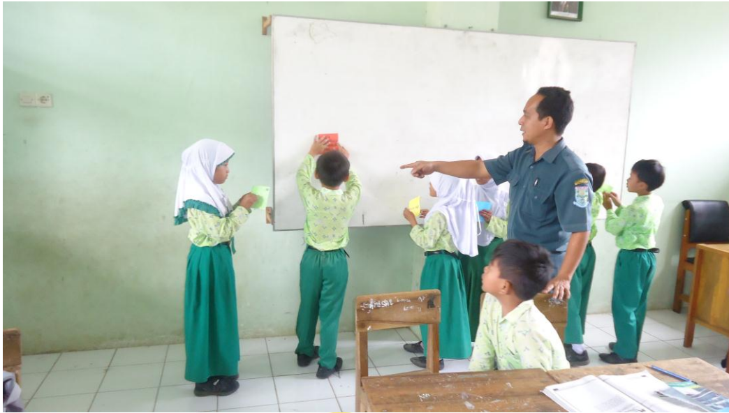
Guru mengarahkan siswa untuk menempel kartu soal dan kartu jawaban di papan tulis