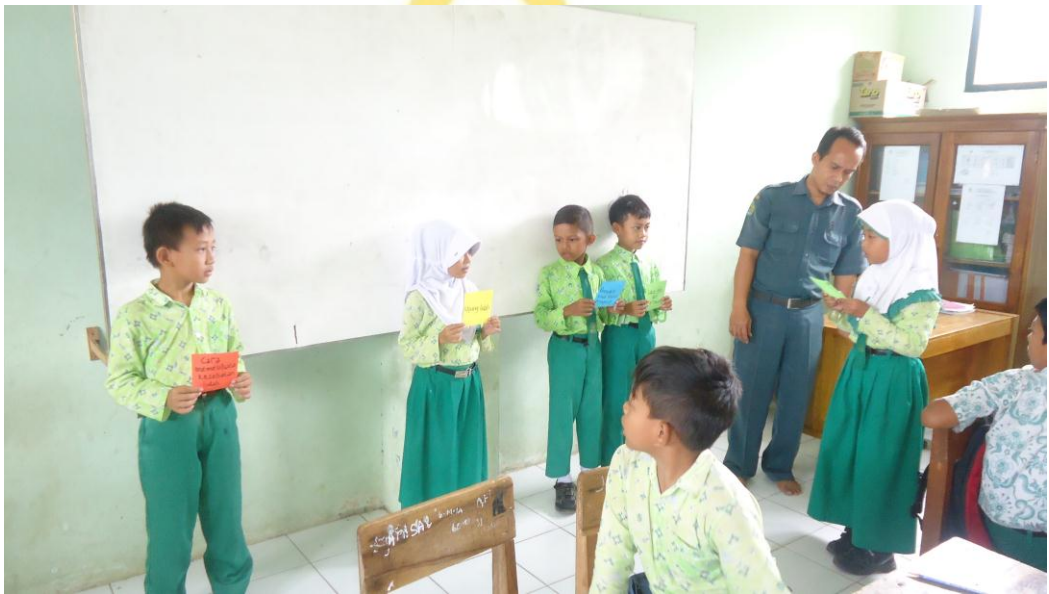
Siswa membacakan soal yang ada dalam kartu soal