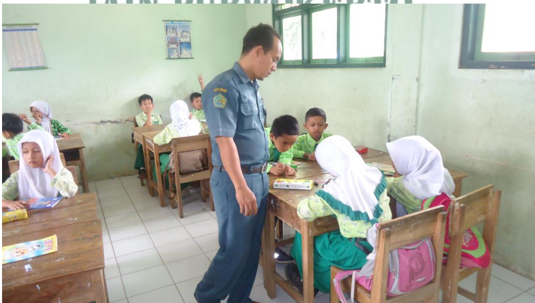
Guru membimbing kelompok-kelompok