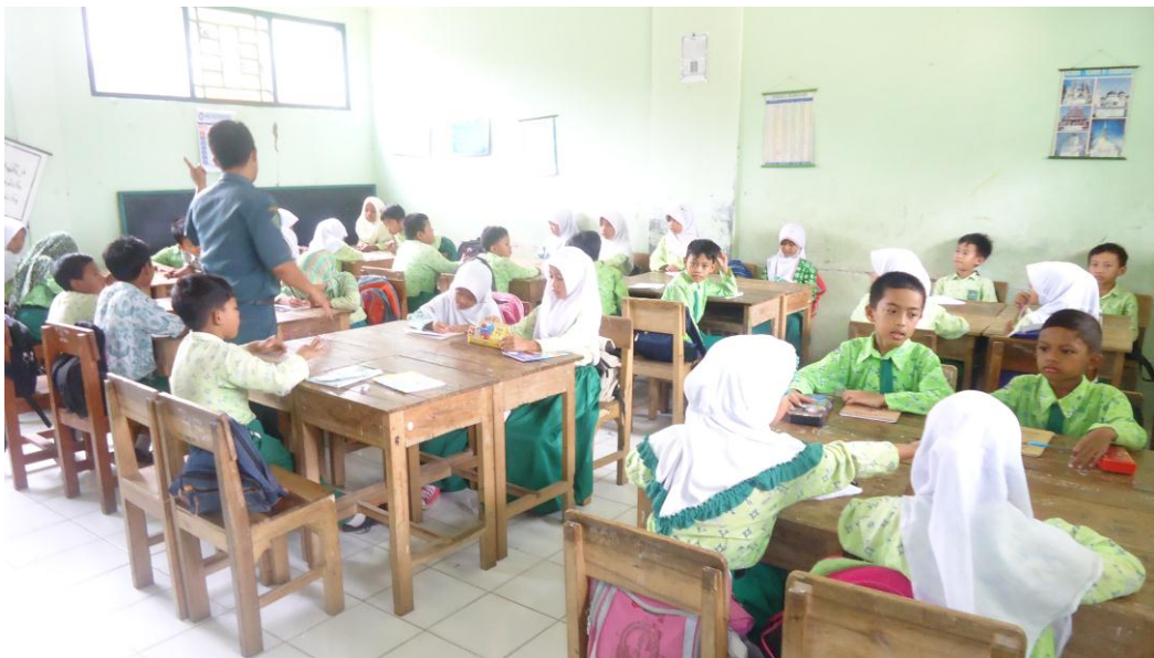
Siswa membentuk kelompok dan guru membimbing kegiatan belajar mengajar