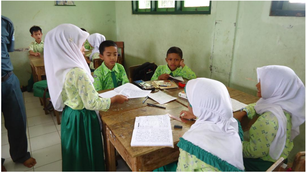
Siswa sedang mengirimkan salam dan soal kepada kelompok lain