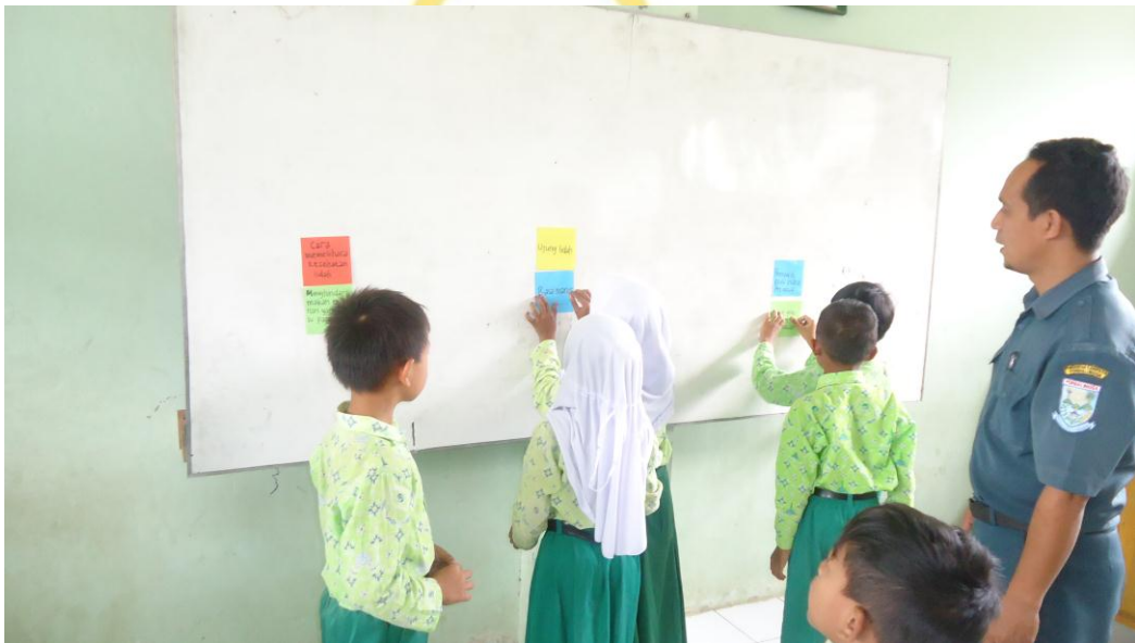
Siswa menempel kartu soal dan kartu jawaban di papan tulis