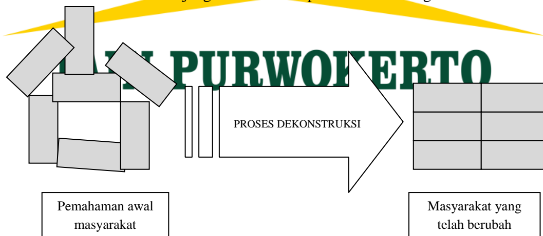
Gambar 1.1 Proses Dekonstruksi Mitos Kanjeng Ratu Kidul

Disitulah hubungan antara penanda-tinanda dipermainkan sehingga muncul differance antara keduanya. Dengan cara seperti itu KH. Ibnu Hajar merombak seluruh bangunan mitos Kanjeng Ratu Kidul. Secara umum, proses dekonstruksi mitos Kanjeng Ratu Kidul dapat dilihat dari bagan dibawah ini: