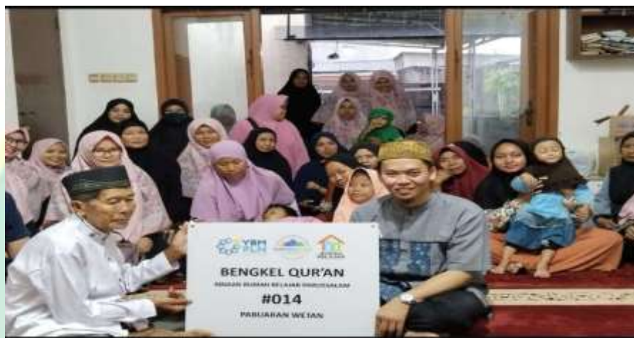
Gambar 4.12 : Kegiatan Bengkel Qur’an di Mushola Pabuaran Ciangsa

“Program Bengkel Qur’an ini yang mengajar adalah santri-santrinya Mahad Darussalam yang hari ini totalnya ada 44 sudah angkatan ketujuh. Jadi, setiap sore ini mereka sebar ke-18 titik sama yang sebagian ada di dalam. Jadi manfaatnya Darussalam ini ya menurut saya ya alhamdulillah tidak hanya di apa dirasakan manfaatnya oleh orang sekitar Darussalam, tapi sudah sampai keluar dan itu gratis tidak berbayar.” 136