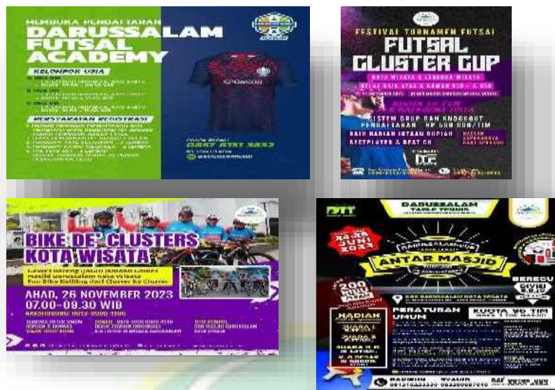
Gambar 4.13 : Gambar informasi kegiatan event olah raga lewat media

Pada tahap aksi dari keluhan jemaah mengenai acara resepsi di lingkungan Masjid Darussalam, melalui Humas pihak manajemen memutuskan untuk kegiatan resepsi, pihak masjid telah membangun fasilitas khusus yaitu Gedung PD yang lokasinya terletak di area belakang agar tidak mengganggu kekhusyukan ibadah di bangunan utama. Langkah ini diambil untuk memastikan ruang shalat tetap bersih, tenang, dan terjaga kesuciannya dari gangguan keramaian acara resepsi.