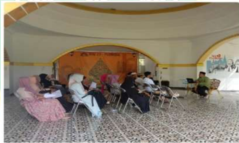
Gambar 4.4 : Kegiatan sosialisasi program Sapa Klaster

Sebagai tindak lanjut nyata dari temuan fakta ( fact-finding ) mengenai keberadaan kelompok marginal (mustahik) di lingkungan klaster akan kebutuhan layanan kesehatan bagi pekerja lokal seperti asisten rumah tangga (ART), petugas keamanan (satpam), dan petugas kebersihan di lingkungan Kota Wisata, kemudian divisi Zakat, Infak, Sedekah, dan Wakaf (ZISWAF) merancang sebuah program “Sapa Kluster”. Program sapa klaster ini merupakan program layanan kesehatan gratis bagi golongan mustahik di klaster dengan pendekatan persuasif. Dan untuk sosialisasi program ini divisi Ziswaf melakukan pertemuan dengan Majelis Ta’lim (MT) Muslimah Kluster Florida pada awal tahun 2024 untuk menyinergikan visi program tersebut.