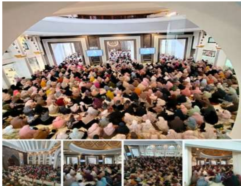
Gambar 4.15 : Kegiatan Tabligh Akbar Masjid Darussalam Kota Wisata