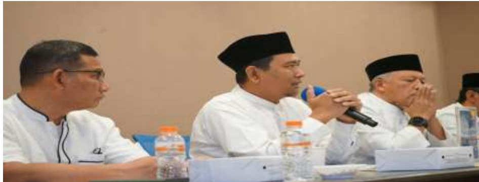
Gambar 4.15 : Kegiatan Raker Tahun 2024 Masjid Darussalam Kota Wisata