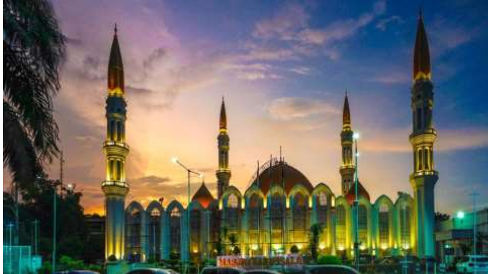
Gambar 4.1 : Masjid Darussalam Kota Wisata Cibubur

kubah yang berjumlah empat menara kecil yang diambil dari filosofi 4 sahabat Nabi Muhammad SAW.