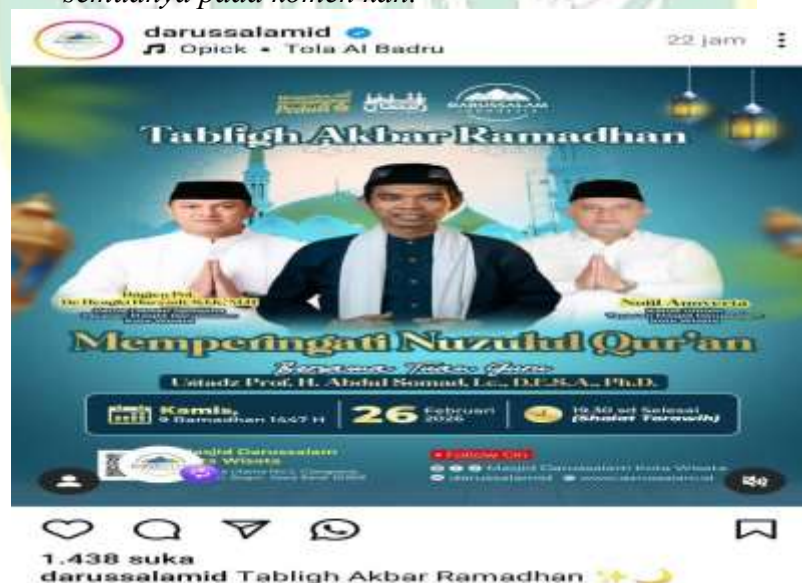
Gambar 4.7 : Campaign Media Sosial Kegiatan Tabligh Akbar Ramadhan 1447 H

“Oke Humas kita punya agenda tablig akbar . Misalkan nanti tanggal 10 Maret. maka alurnya dari divisi Ibadah dan Dakwah kasih materi konten ke Humas mengenai narasumbernya siapa, tanggalnya kapan, harinya kapan. Itu buat sebaik mungkin, didesain sebaik mungkin untuk nantinya di-upload. Nah, itu ada pra event. Pra event itu kami coba untuk apa? Mancing audiens atau followers di Instagram. Kemudian dengan konten Reels yang bunyinya kalau Masjid Darussalam mengadakan Tablig Akbar; kira-kira yang pengen ? Nanti semuanya pada komen kan.” 132