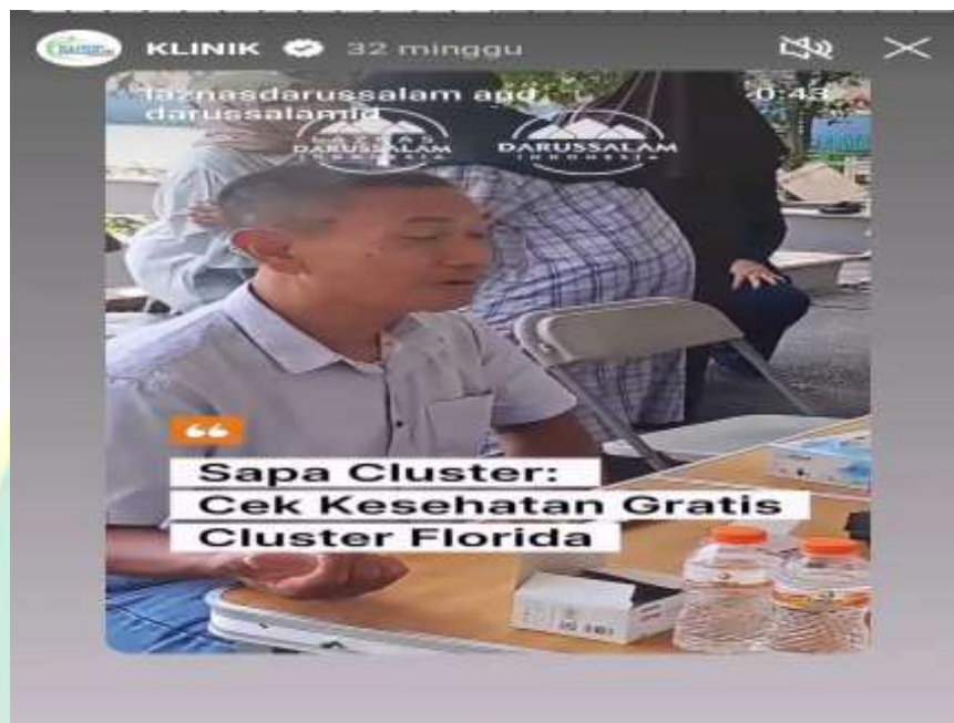
Gambar 4.11 : Kegiatan cek kesehatan gratis program Sapa Klaster

program dapat diterima dengan baik oleh warga. Integrasi antara aksi medis dan koordinasi kewilayahan ini membuktikan bahwa Humas Masjid Darussalam berhasil membangun jejaring sosial yang kuat, sehingga pesan kepedulian masjid tersampaikan secara tepat sasaran kepada publik internalnya.