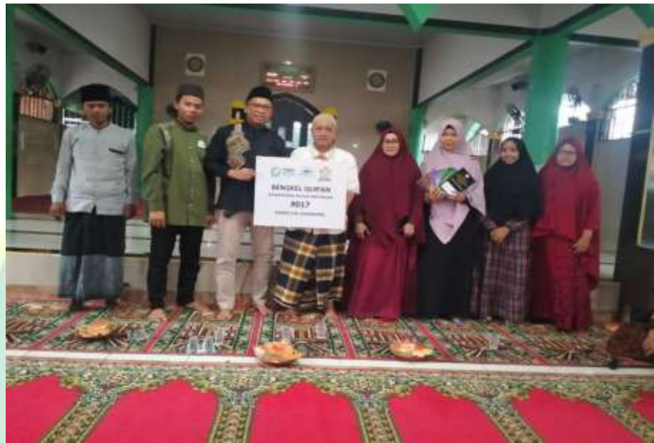
Gambar 4.5 : Peresmian Bengkel Qur'an Kampung Cikeas Ilir Ciangsana Bogor

fokus pada jemaah internal kota wisata, tetapi merancang akses dakwah yang inklusif bagi masyarakat sekitar. Peneliti menilai bahwa rencana ini bertujuan untuk membangun saling pengertian ( Mutual Understanding ) dan menghapus kesan eksklusif masjid, sehingga keberadaan Masjid Darussalam benar-benar dirasakan manfaatnya oleh warga di luar pagar perumahan