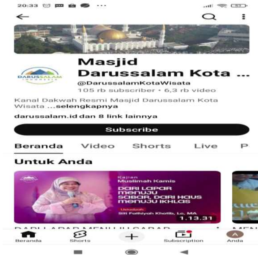
Gambar 4.16 : Channel YouTube @darussalamKotaWisata

pengikut 149 . Data akhir Maret 2026 channel YouTube@DarussalamKotaWisata berjumlah 105.000 subscriber dan akun Instagram berjumlah 56.200 followers , data tersebut membuktikan adanya peningkatan partisipasi jemaah yang nyata melalui optimalisasi media digital