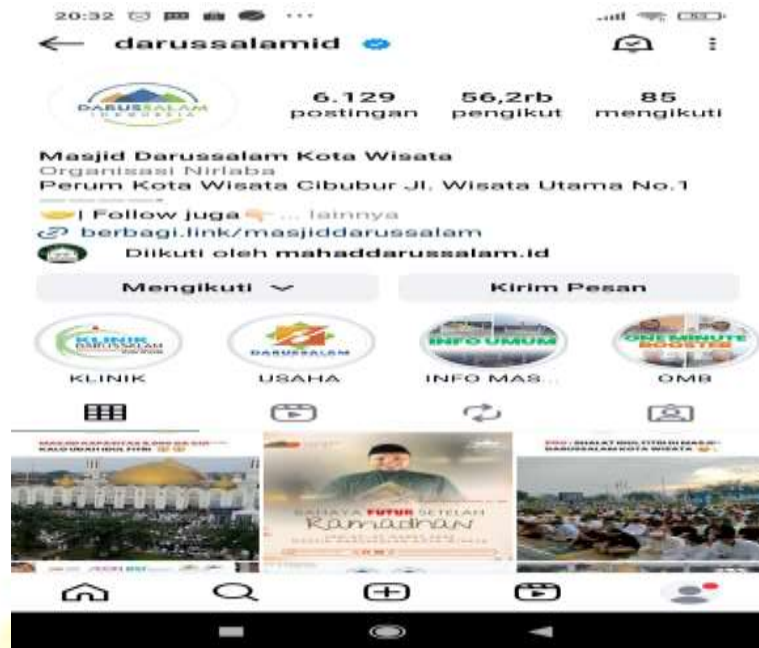
Gambar 4.16 : Profile Akun Instagram Masjid Darussalam Kota Wisata