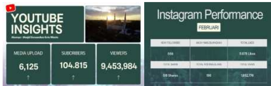
Gambar 4.6 : Perencanaan berdasarkan metrik media

Sumber : Dokumentasi Humas Masjid Darussalam Kota Wisata