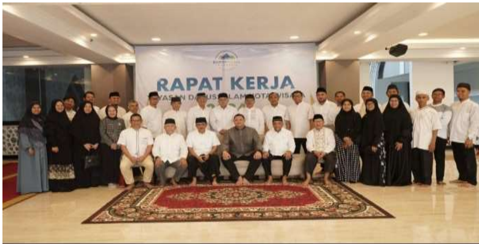
Gambar 4.10 : Rapat Kerja Pengurus Yayasan Masjid darussalam 2024