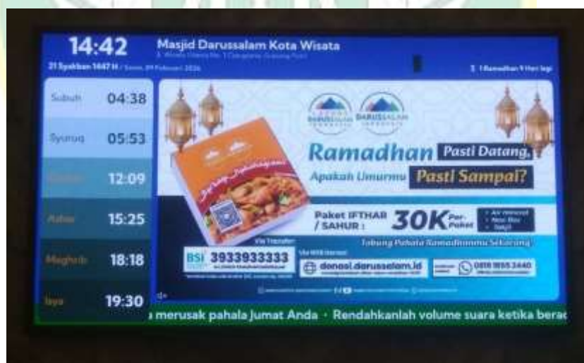
Gambar 4.14. Campaign kegiatan Ramadhan 1447 H Masjid Darussalam

Selain media digital, edukasi visual di lapangan juga diperkuat melalui pemanfaatan Videotron dan TV Masjid sebagai pengganti instruksi suara konvensional, sehingga menciptakan pengalaman informasi yang lebih modern, tertata, dan profesional bagi jemaah.