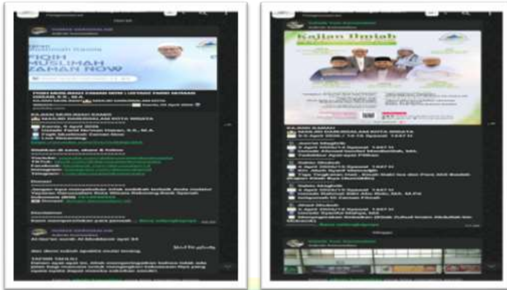
Gambar 4.17 : Grup WA Muslimah dan Grup WA Kajian Umum Masjid Darussalam Kota Wisata

Sumber : Humas Masjid Darussalam Kota Wisata