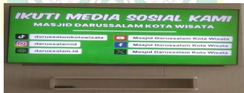
Gambar 4.16 : videotron informasi alamat akun medson masjid Darussalam

“ setiap hari Kamis. Biasanya saya mendapat informasi kajian ibu ibu ini dari Instagram, dari situ saya bisa lihat kajian Kamis minggu ini apa topiknya dan siapa pengisi kajiannya. Ibu juga kadang informasi dari WA teman. teman saya rutin ikut kajian terus saya diajak sampai sekarang.” 154