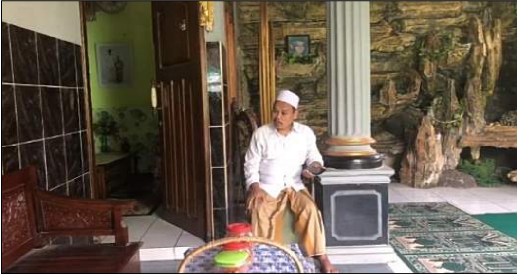
Gambar 7. Halaman Penjara Panti