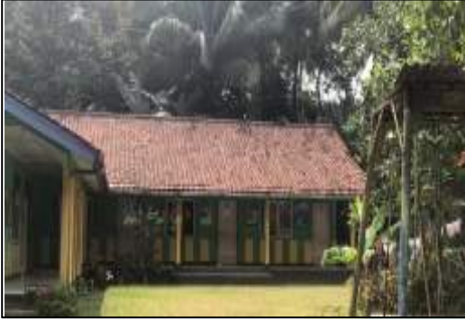
Gambar 1. Kamar Tidur