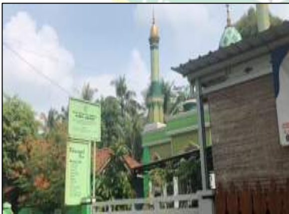
Gambar 4. Masjid Panti