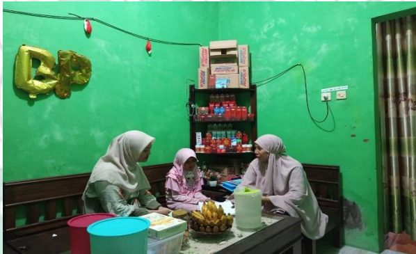
Gambar 3 Wawancara dengan Informan 3