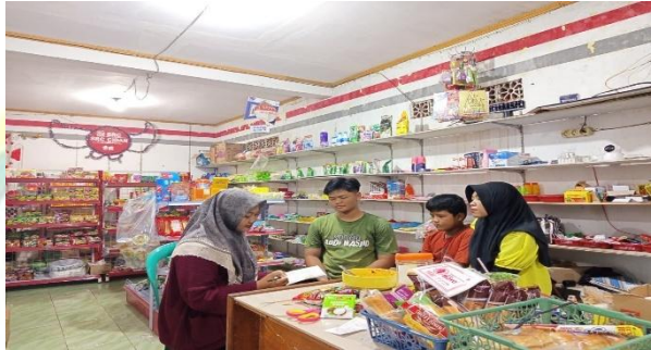
Gambar 2. Wawancara dengan Informan 2