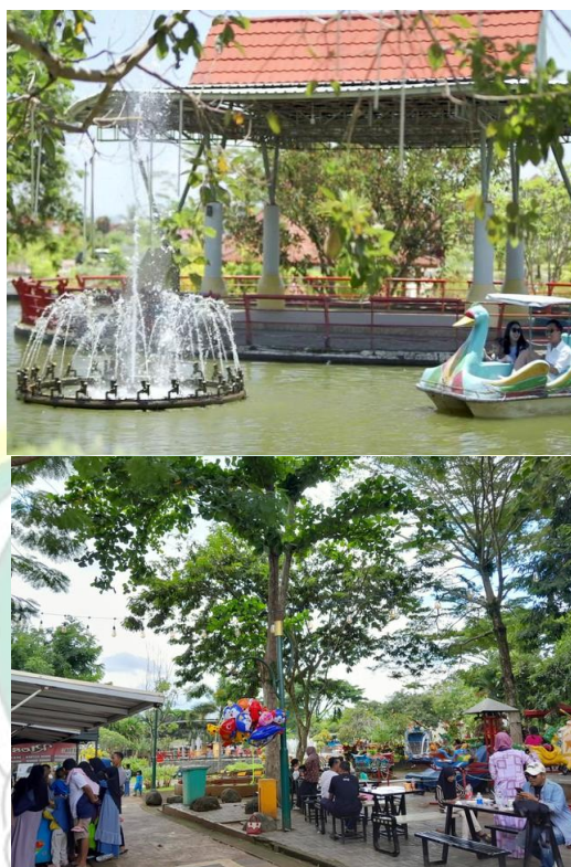
Gambar 4.2 kondisi Taman Mas Kemambang sesudah revitalisasi