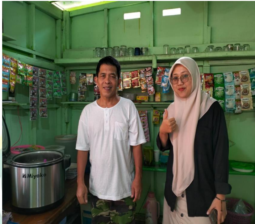
3. Kondisi Objek wisata Taman Mas Kemambang