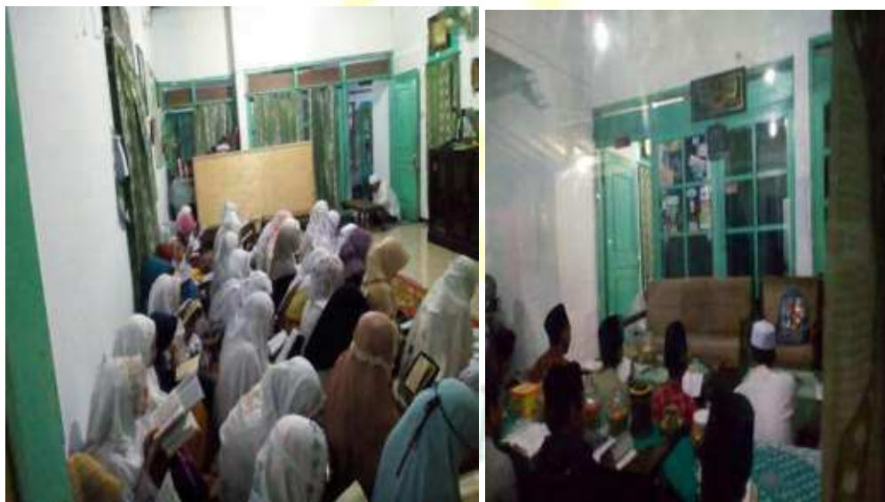
Kegiatan Tartilan Malam Selasa