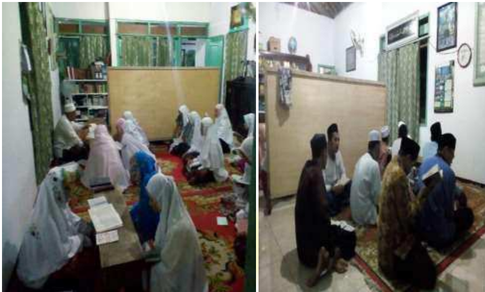
Kegiatan Mengaji Deresan Santri Tahfiz Al-Qur'an Ba'da 'Isya