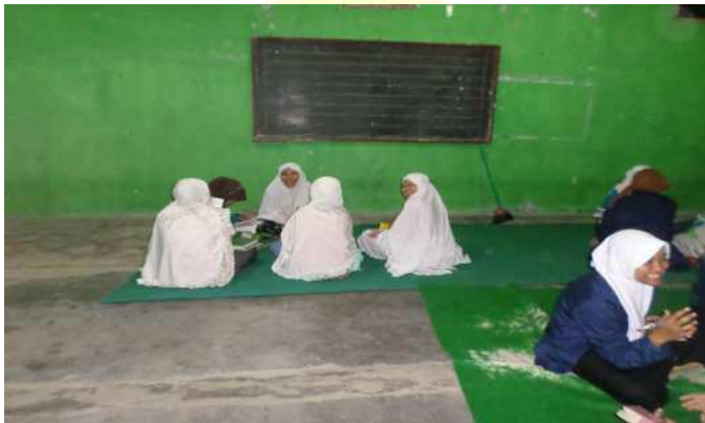
Tutoran Juz 'Amma Santri Putri