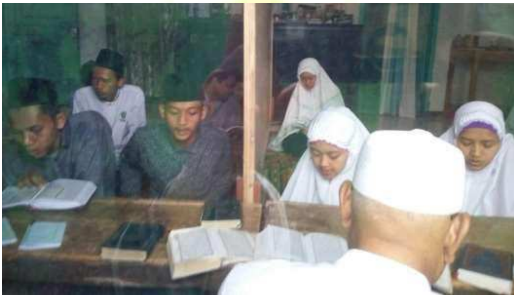
Kegiatan Mengaji Setoran Santri Tahfiz Al-Qur'an Ba'da 'Asar