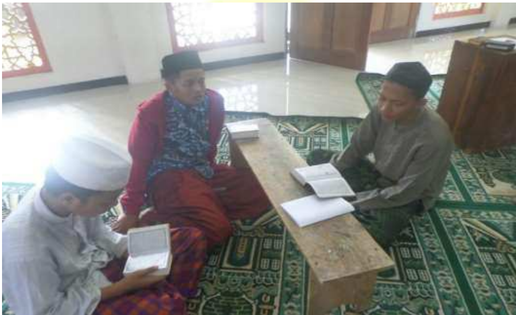
Sema'an Jum'at dan Minggu Pagi Santri Putra