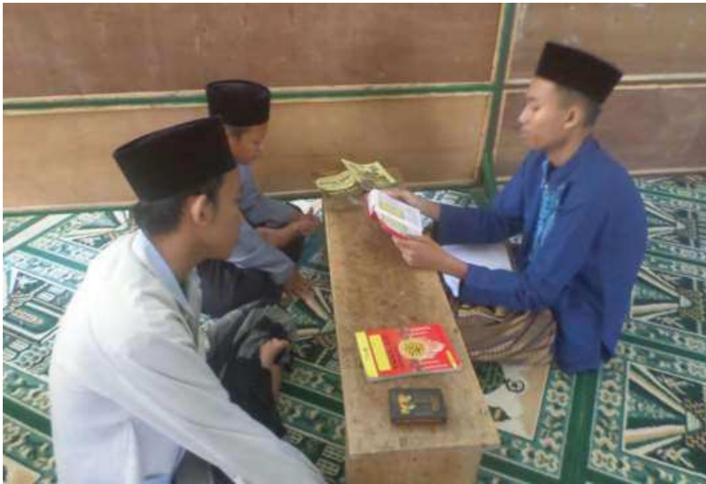
Tutoran Juz 'Amma Santri Putra