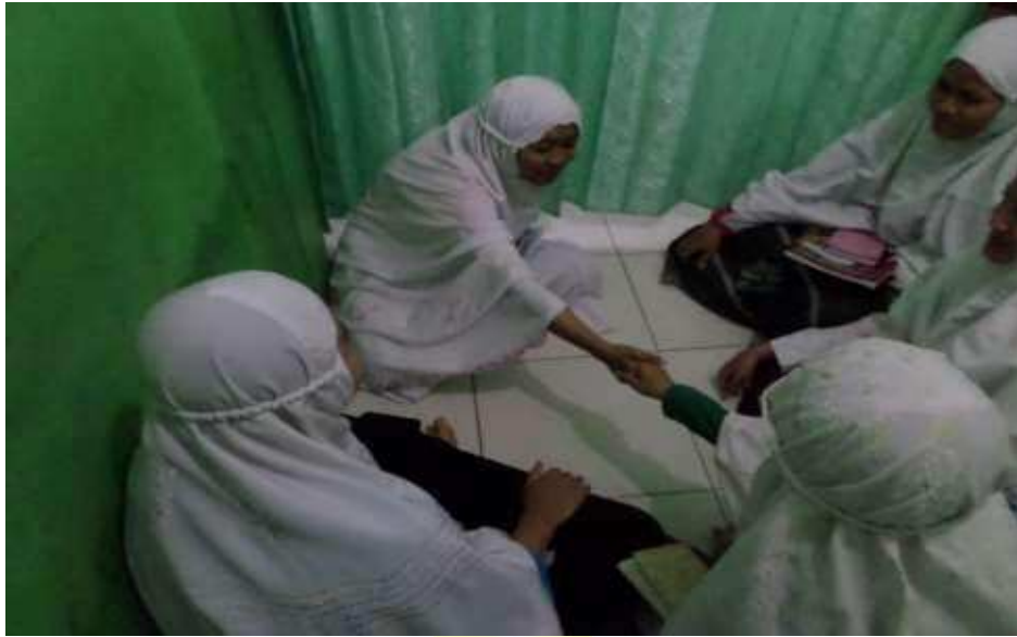
Sema'an Sekali Duduk 5 Juz