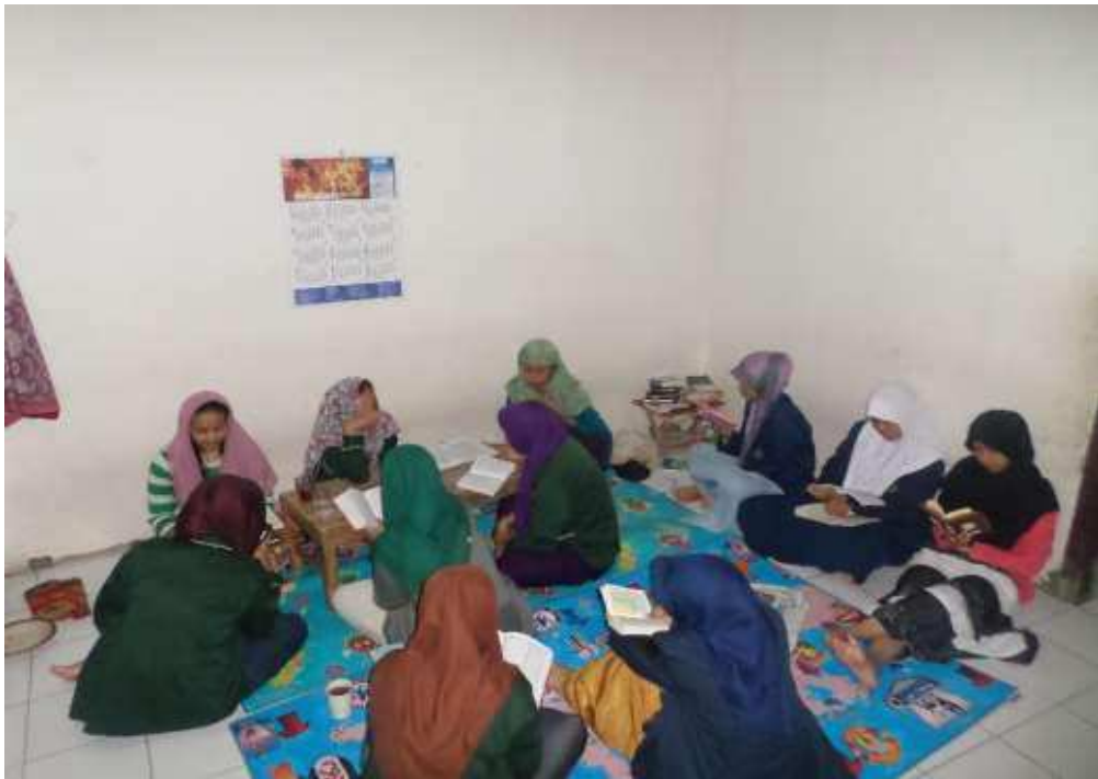
Sema'an Jum'at dan Minggu Pagi Santri Putri