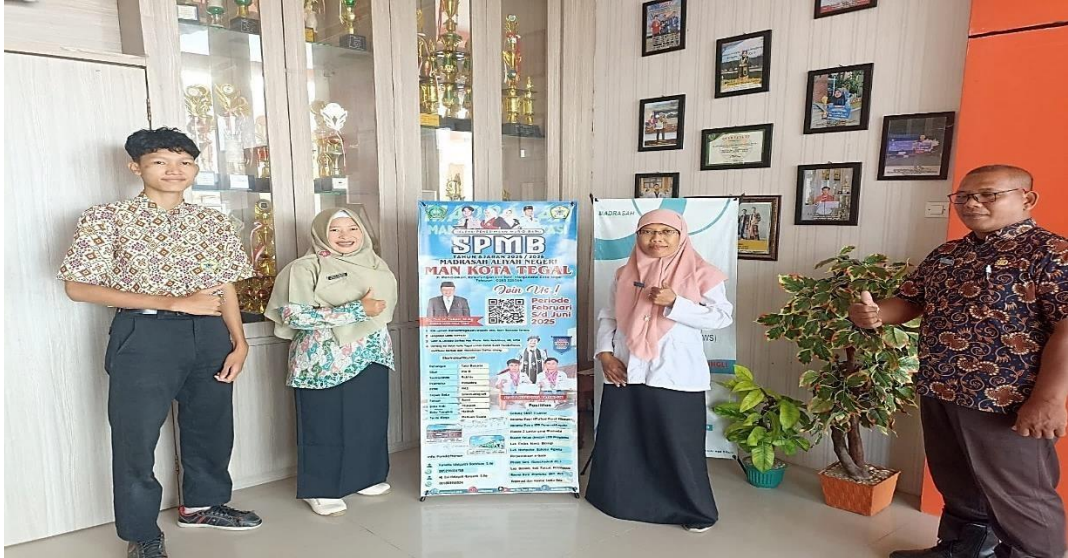
Peneliti disambut baik oleh Kepala Sekolah, Waka kurikulum dan Siswa MAN Kota Tegal yang dilaksanakan tanggal 12 Februari 2025