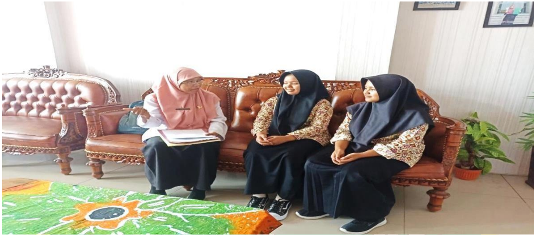
Kegiatan wawancara dengan siswa MAN Kota Tegal yang dilaksanakan 26 Februari 2025