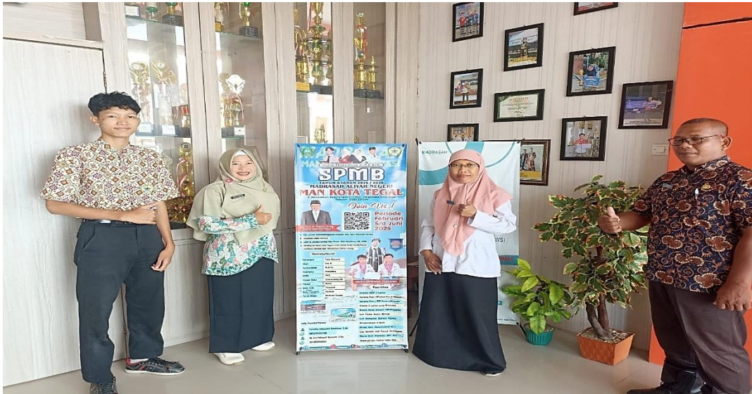
Peneliti disambut baik oleh Kepala Sekolah, Waka kurikulum dan Siswa MAN Kota Tegal yang dilaksanakan tanggal 12 Februari 2025