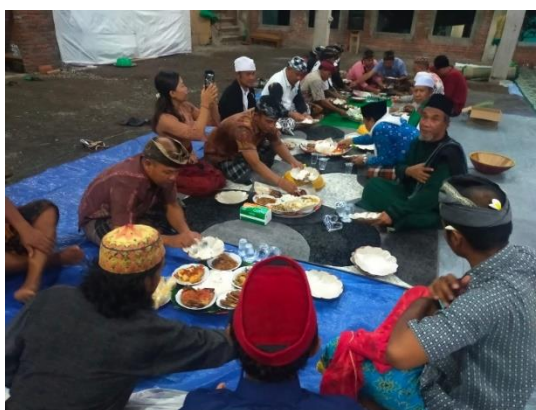
Figure 1 Megibung Tradition between Hindu and Islamic Communities in Kampung Saren Jawa

only carried out megibung with the Hindu community. However, after the arrival of Islam in Bali, megibung was eventually carried out with Islamic communities, so until this time, Hindu and Islamic communities used megibung as a means of respecting religions. Almost all people follow the megibung tradition, and no one from these two religions refuses to come. Megibung is believed to be one of the ways to maintain solidarity between religions. Thus, carrying out the megibung tradition will maintain solidarity between religious communities in Budakeling Village.