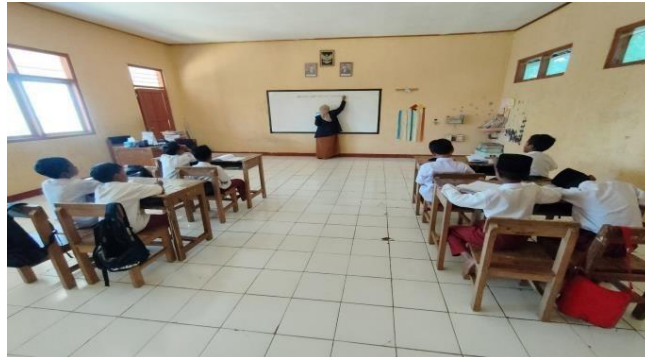
Gambar 3. Pelaksanaan kegiatan belajar mengajar

metode pembelajaran berbasis Student-Centered Learning merupakan kunci keberhasilan dalam proses pembelajaran yang diterapkan oleh lembaga pendidikan, khususnya oleh para pendidik 9 .