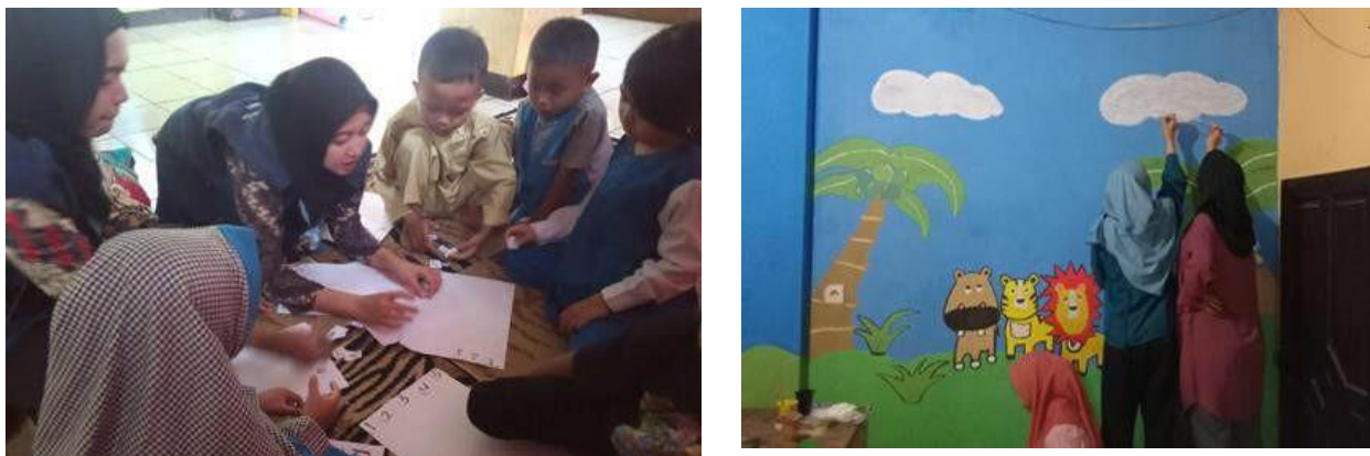
Gambar 2. Mahasiswa mengajar di TK Risalatul Falah

Berdasarkan hasil pengamatan selama kegiatan pembelajaran, anak-anak di TK Risalatul Falah cenderung terlihat merasa bosan. Hal tersebut dikarenakan masih minimnya sarana dan prasarana yang lebih mendukung untuk kegiatan belajar mengajar. Dengan demikian, mahasiswa KKN 109 Desa Cipaku berinisiatif untuk memperbaiki dekorasi ruangan kelas agar lebih berwarna dan bervariasi. Dekorasi tersebut meliputi kegiatan mengecat tembok dengan tema hewan dan sekolah, serta membuat aksesoris-aksesoris kelas lainnya untuk membantu menstimulasi perkembangan anak-anak. Selain itu mahasiswa KKN 109 Desa Cipaku juga membuat media baru untuk pembelajaran berbasis proyek, seperti yang dapat dilihat di gambar 2, mahasiswa KKN 109 Desa Cipaku mengaplikasikan medianya kepada anak-anak TK Risalatul Falah untuk mengurangi rasa bosan anak-anak dan meningkatkan rasa semangatnya untuk terus bermain sambil belajar.