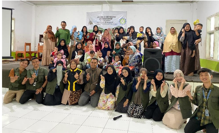
Figure 6. dokumentasi kolaborasi