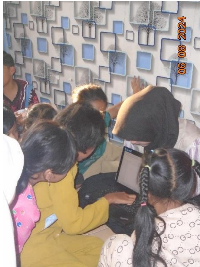
Gambar 2. Implementasi Pelatihan IT