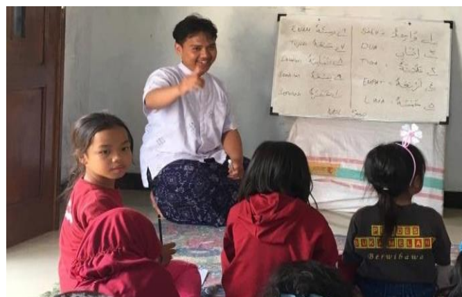
Gambar 6. Kegiatan Bimbel bahasa Arab

Selain mengajar di sekolah dasar, kami juga mengadakan Bimbel bahasa Arab dan bahasa Inggris, yakni kegiatan belajar sambil bermain yang diikuti oleh anak-anak Kp. Tenjolaya dan berlokasi di Posko KKN.