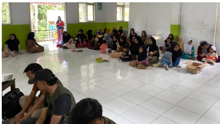
Figure 5. masyarakat yang hadir