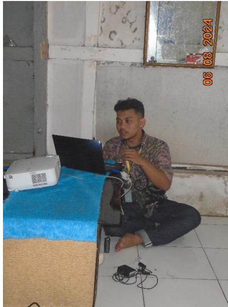
Gambar 2. Penyuluhan Teknologi Informasi

Untuk anak-anak, sosialisasi dilakukan dengan cara yang menyenangkan, seperti melalui permainan edukatif yang mengajarkan dasar-dasar penggunaan komputer. Bagi remaja, sosialisasi lebih mendalam, mencakup diskusi tentang aplikasi praktis keterampilan IT dalam kegiatan sehari-hari dan peluang karir yang mungkin terbuka bagi mereka di masa depan. Sosialisasi ini bertujuan untuk membangun pemahaman dan antusiasme peserta terhadap pelatihan yang akan dilakukan.