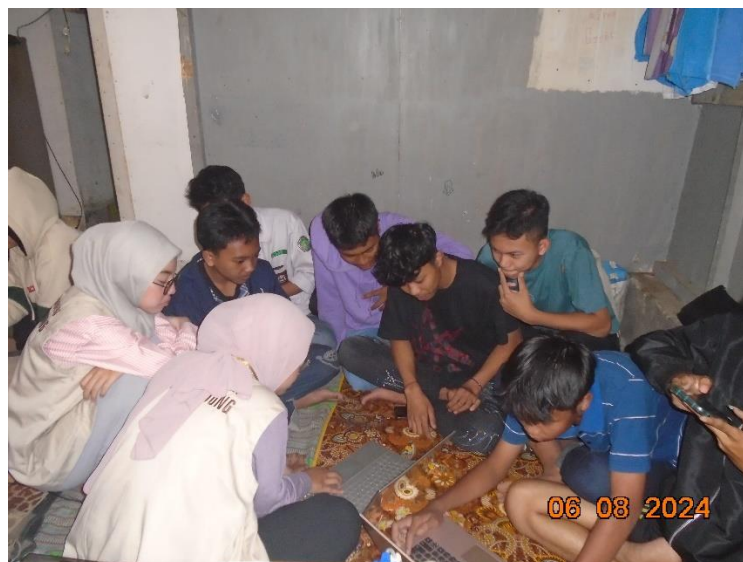
Gambar 3 Implementasi Pelatihan IT

Bagi remaja, pelatihan mencakup keterampilan IT lebih lanjut. Ini termasuk penggunaan perangkat lunak produktivitas seperti Microsoft Word dan Excel, keterampilan pencarian informasi online, serta konsep dasar pemrograman. Remaja juga diperkenalkan pada pembuatan konten digital, seperti desain grafis dan editing video, yang dapat mendukung kreativitas mereka dan membuka peluang untuk proyek pribadi atau usaha sampingan. Pelatihan dilakukan melalui proyek berbasis kelompok dan simulasi praktis yang memungkinkan peserta untuk langsung menerapkan keterampilan yang telah dipelajari.