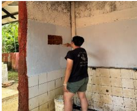
Gambar 8. Pengecatan dinding tempat wudhu

wudhu. Dengan dilakukan pengecatan ulang, dinding tempat wudhu kini tampak lebih cerah dan bersih. Selain memperindah tampilan, pengecatan dinding juga memberikan perlindungan ekstra terhadap dinding dari kerusakan lebih lanjut. Lapisan cat baru membantu melindungi permukaan dinding dari kelembapan dan paparan air yang sering terjadi di area wudhu. Dengan lingkungan wudhu yang lebih bersih dan terawat, jamaah merasa lebih nyaman dan tenang saat bersuci sebelum beribadah.