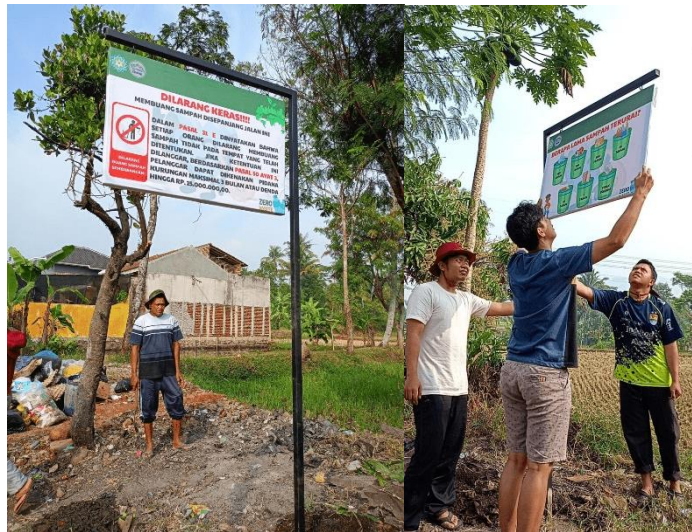
Gambar.5 Plang Edukasi Sampah Dari Stainless

menjaga lingkungan. karena pada dasarnya bencana timbul dari sampah dan kurangnya kesadaran manusia dalam menjaga lingkungan.