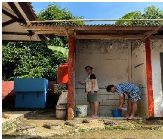
Gambar 7. Penggantian keran air wudhu yang rusak

Sebelum dilakukan penggantian, beberapa keran mengalami kebocoran dan tidak berfungsi dengan baik, sehingga menghambat aktivitas jamaah dalam bersuci sebelum shalat. Keran yang rusak ini menyebabkan air terbuang sia-sia dan mengurangi efisiensi penggunaan air di area wudhu. Dengan penggantian keran baru, kini jamaah dapat berwudhu dengan lebih mudah dan nyaman, tanpa harus terganggu oleh keran yang bocor atau tidak berfungsi.