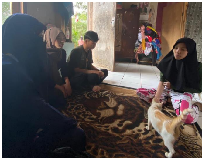
Figure 2. kerja sama penyebaran undangan kepada tokoh setempat