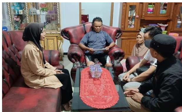
Gambar 1. Foto bersama kepala RW 04

Pada tahapan awal ini, mahasiswa melakukan wawancara dan observasi secara langsung bersama aparat desa setempat, khususnya ketua RW 04 Kp. Tenjolaya.