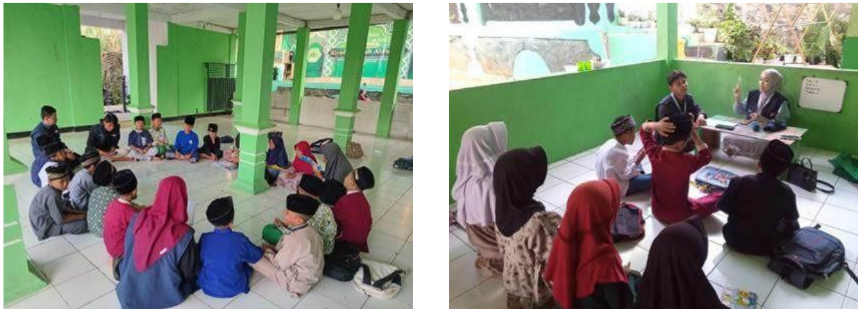
Gambar 4. Mahasiswa mengajar ngaji di Madrasah Riyadul Falah Al-Furqon

Mahasiswa KKN kelompok 109 mendapatkan kesempatan mengajar di Madrasah Riyadul Falah Al-Furqon pada sore hari bersama santri SD kelas 4, 5, dan 6. Sebagian besar anak-anak yang mengaji sore di Madrasah Riyadul Falah Al-Furqon sudah berusia 10-13 tahun, sehingga sudah lebih mudah untuk diarahkan. Ustadz Rizki, sejak lama menekankan pentingnya tajwid dalam pengajaran Iqro dan Al-Qur'an. Hal ini membuat banyak santri di Madrasah Riyadul Falah Al-Furqon yang sudah mencapai iqro 5 dan 6, bahkan beberapa sudah mampu membaca Al-Qur'an dengan lancar.