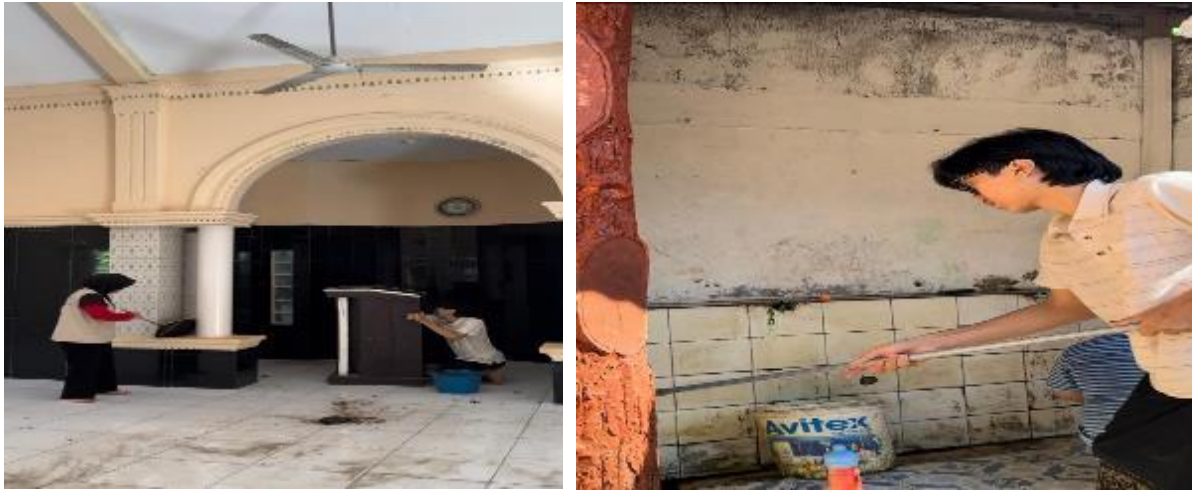
Gambar 2(a), 2(b), 2(c), dan 2(d). Observasi dan pengambilan data