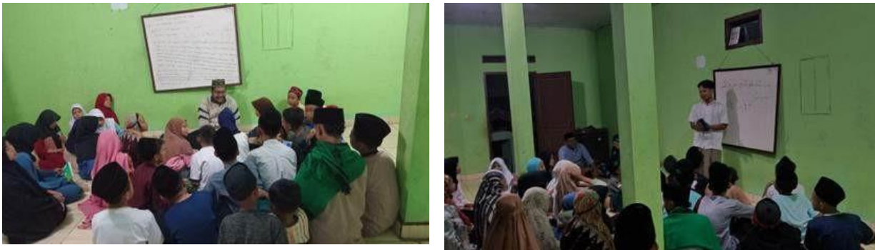
Gambar 3. Mahasiswa mengajar ngaji di Madrasah Risalatul Falah

Santri dan Santriwati di Madrasah ini cukup banyak, sedangkan SDM guru yang kurang dan waktu yang terbatas membuat ketidakmerataan kemampuan anak-anak dalam menyerap pembelajaran, khususnya dalam membaca Al-Qur'an. Karena belajar Al-Qur'an diperlukan keuletan dan kesabaran yang ekstra dalam belajar maupun mengajarkannya. Selama kegiatan pengabdian, mahasiswa KKN kelompok 109 Desa Cipaku membantu kegiatan belajar mengajar di Madrasah Risalatul Falah dengan membagi kelompok, satu kelompoknya berjumlah 5 santri/santriwati. Kegiatan tersebut bertujuan agar kemampuan membaca Al-Qur'an anak-anak bisa lebih merata dan lebih optimal lagi. Mahasiswa KKN kelompok 109 Desa Cipaku juga membagikan ilmu tajwid dengan menggunakan Nadzom, sehingga pembelajaran pun bisa lebih menyenangkan.