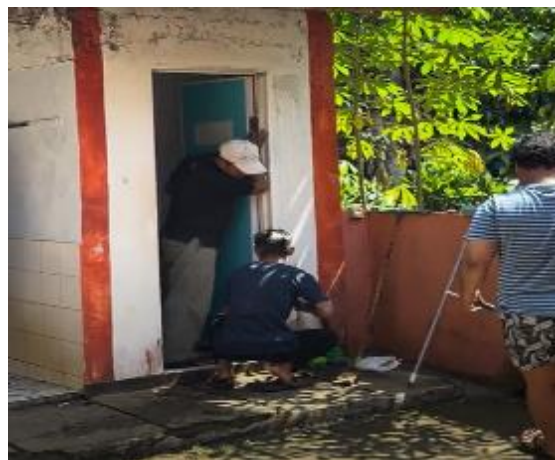
Gambar 10. Penggantian pintu kamar mandi masjid

Penggantian pintu kamar mandi menghasilkan sejumlah perbaikan yang signifikan. Secara fungsional, pintu baru yang dipilih lebih kokoh dan aman dibandingkan dengan pintu lama, sehingga mengurangi risiko kerusakan dan meningkatkan keamanan penggunaan. Selain itu, pintu yang baru juga lebih efisien dalam menjaga privasi dan mengoptimalkan pengaturan ruang kamar mandi.