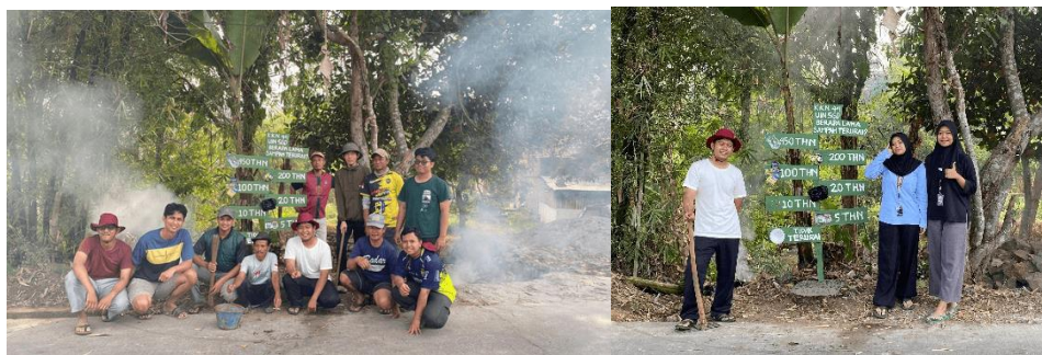
Gambar 6. Plang Edukasi Sampah Terurai dari Kayu

Dalam Kegiatan ini, Kami mendapatkan respon dan hasil positif dari masyarakat, menurut masyarakat sekitar plang edukasi sampah terurai tersebut sangatlah membantu dalam mengatasi masyarakat yang sering membuang sampah ke selokan sehingga dengan adanya plang edukasi ini mampu mengubah prilaku dan mecerdaskan masyarakat dan orang lain yang melintasi jalan babakan dalam mengelola sampah. Berikut data respon masyarakat terkait plang edukasi sampah terurai: