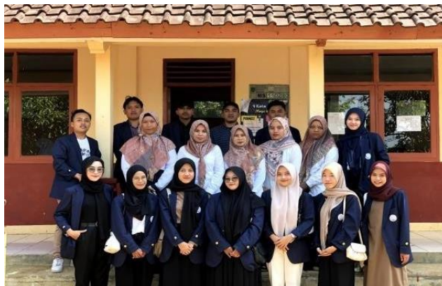
Gambar 2. Observasi sekolah

Pada tahap kedua ini, mahasiswa mulai menyadari masalah yang ada di masyarakat sekitarnya. Di tahap ini, mereka mengembangkan program pendampingan dalam bidang pendidikan untuk anak-anak dengan mengadakan kegiatan belajar bersama. Selain itu, mereka juga melakukan koordinasi rencana mengajar di MIS Miftahul Huda.