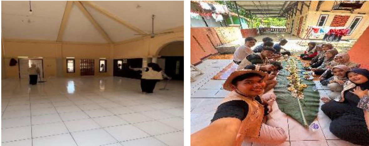
Gambar 3(a), 3(b), 3(c), dan 3(d). Proses analisis data untuk penarikan kesimpulan