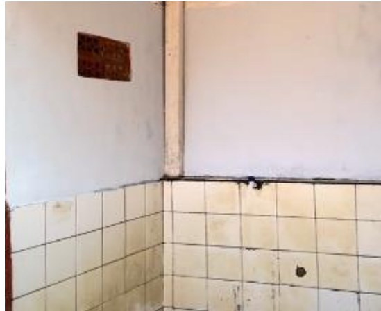
Gambar 9. Pemasangan Hiasan di Dinding Tempat Wudhu dan Area Masjid