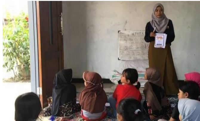
Gambar 7. Kegiatan Bimbel bahasa Inggris

Kegiatan Bimbel ini dilaksanakan selama dua pekan dilakukan di rentang waktu KKN berlangsung setiap hari sabtu dan minggu. Kegiatan ini merupakan kegiatan belajar bersama sambil bermain dan bertujuan untuk menumbuhkan semangat belajar pada anak sejak dini.