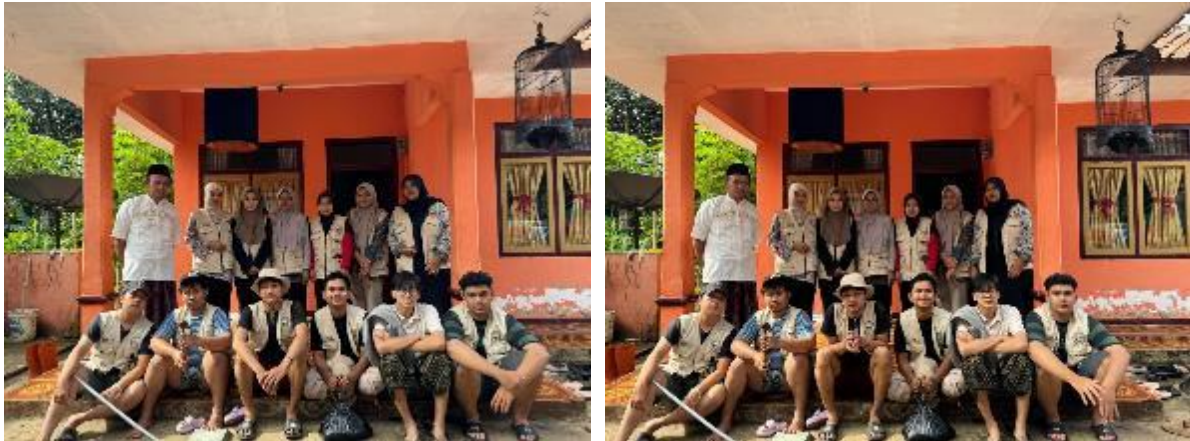
Gambar 1(a) dan 1(b). Musyawarah dengan ketua MUI

memutuskan topik yang akan dibahas: rendahnya kesadaran masyarakat terhadap kebersihan dan kenyamanan masjid.