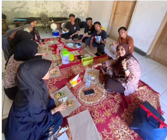
Figure 3. briefing panitia dengan narasumber