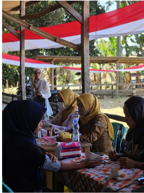
Gambar 1. Pemeriksaan Tekanan Darah