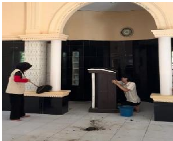
Gambar 4. Pembersihan area dalam masjid

Memberikan kontribusi besar terhadap peningkatan kenyamanan jamaah. Sebelum pembersihan, area dalam masjid, termasuk lantai dan bagian sekitar mimbar, tampak berdebu dan kotor akibat seringnya digunakan tanpa perawatan yang memadai. Kondisi ini menimbulkan ketidaknyamanan bagi jamaah yang beribadah, terutama ketika melakukan sujud dan duduk. Setelah pembersihan, lantai masjid terlihat lebih bersih dan terawat, membuat suasana lebih nyaman untuk beribadah. Jamaah tidak lagi khawatir tentang kebersihan tempat mereka berdoa, dan kegiatan ibadah dapat dilakukan dengan lebih khushyuk. Peningkatan kebersihan ini secara langsung memengaruhi suasana spiritual dalam masjid, menciptakan atmosfer yang lebih damai dan menenangkan. Jamaah lebih dapat fokus pada ibadah tanpa terganggu oleh kondisi lingkungan yang kurang bersih.