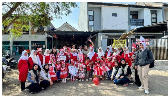
Gambar 4. Kegiatan sosial

Pendidikan sensorik juga penting, dengan melakukan aktivitas yang merangsang indra melalui bermain dengan tekstur yang berbeda, mendengarkan berbagai jenis suara, dan bekerja dengan berbagai jenis bahan dan alat. Pengembangan program dan modul juga diperlukan untuk membantu pembuatan materi atau modul pendidikan yang dapat digunakan secara berkesinambungan untuk mendukung perkembangan motorik ABK, serta mengembangkan pedoman dan strategi bagi pendidik atau terapis dalam melaksanakan program latihan. Penilaian dan evaluasi juga penting, dengan melakukan penilaian awal dan akhir untuk mengukur perkembangan motorik anak sebelum dan sesudah pelaksanaan kegiatan KKN, serta mengumpulkan umpan balik dari anak-anak, orang tua, dan pendidik untuk mengevaluasi efektivitas kegiatan dan mengidentifikasi peluang perbaikan.