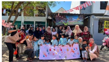
Gambar 1. Sosialisasi anti perundungan

Pelaksanaan kegiatan KKN mahasiswa dalam meningkatkan kemampuan motorik anak berkebutuhan khusus (ABK) melibatkan beberapa langkah penting yang dirancang untuk memastikan efektivitas dan keberlanjutan program. Kegiatan dimulai dengan acara pembukaan yang melibatkan seluruh peserta, termasuk anak-anak berkebutuhan khusus, orang tua, guru, dan tenaga medis. Acara ini bertujuan untuk memperkenalkan program dan tujuan kegiatan kepada semua pihak yang terlibat. Mahasiswa kemudian memberikan orientasi kepada anak-anak dan orang tua mengenai jenis-jenis kegiatan yang akan dilakukan, manfaatnya, serta cara partisipasi yang diharapkan.