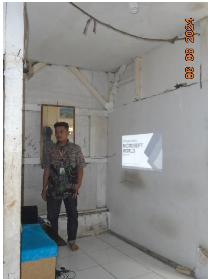
Gambar 1. Penyuluhan Teknologi Informasi

Sebelum pelatihan IT dimulai, tim KKN melakukan penyuluhan dan sosialisasi untuk mempersiapkan peserta dan komunitas. Penyuluhan ini dilakukan melalui seminar dan workshop yang diadakan di komunitas desa, melibatkan anak-anak, remaja, orang tua, dan guru. Seminar ini bertujuan untuk memperkenalkan pentingnya keterampilan IT dan menjelaskan bagaimana pelatihan akan dilakukan. Tim KKN menjelaskan manfaat teknologi dalam pendidikan dan kehidupan sehari-hari, serta bagaimana keterampilan TI dapat membuka peluang baru untuk masa depan.