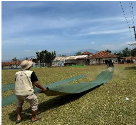
Gambar 5. Pembersihan karpet masjid

masalah kesehatan, terutama bagi jamaah yang sensitif terhadap debu. Kegiatan pembersihan karpet ini berhasil menghilangkan kotoran yang menumpuk, sehingga membuat karpet kembali bersih dan nyaman untuk digunakan. Dengan karpet yang higienis, jamaah merasa lebih nyaman saat melakukan sujud dan duduk selama shalat. Kebersihan karpet juga berperan penting dalam menjaga citra masjid sebagai tempat ibadah yang layak dan bersih. Karpet yang bersih mencerminkan keseriusan pengelola masjid dalam menjaga kenyamanan dan kebersihan tempat ibadah.