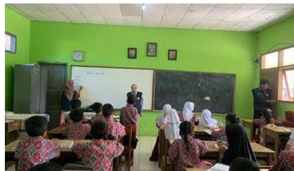
Gambar 1. Mahasiswa mengajar di SD Negeri Nangela

Selama kegiatan belajar mengajar berlangsung, teridentifikasi beberapa kendala yang mahasiswa KKN 109 hadapi. Seperti beberapa siswa di kelas 2 yang sangat aktif dan sulit diarahkan sehingga proses pembelajaran menjadi kurang efektif, ada juga siswa yang belum pandai menulis sehingga membuat dirinya tertinggal pembelajaran. Lain halnya di kelas 4, masalah yang dihadapi yaitu siswa yang cenderung pasif dan tidak banyak berinteraksi selama pembelajaran. Dengan demikian, mahasiswa KKN 109 perlu menciptakan suasana pembelajaran yang lebih interaktif, proaktif dalam menarik perhatian siswa, dan mendorong siswa agar lebih terlibat dalam pembelajaran. Hal ini bisa dilakukan dengan mengadakan games, ice breaking, kuiz, bernyanyi, ataupun sesi tanya jawab.