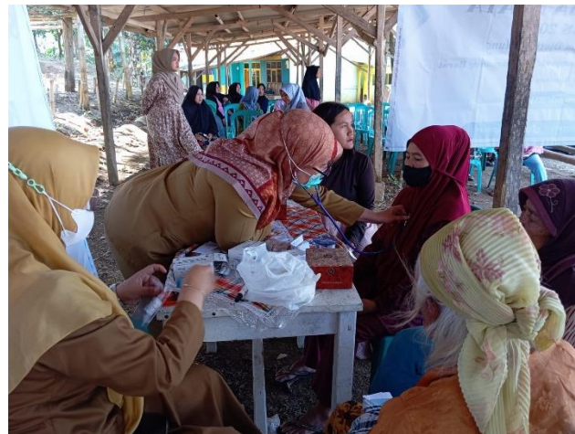
Gambar 2. Pemeriksaan Detak Jantung