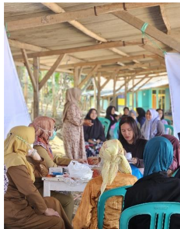
Gambar 3. Cek Kesehatan