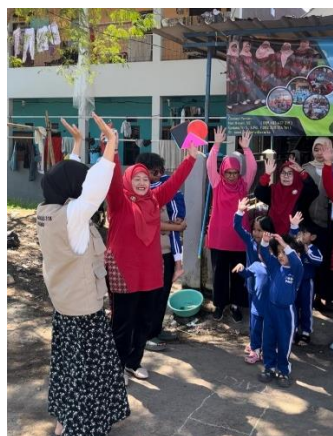
Gambar 2. Motorik kasar

Pelaksanaan kegiatan KKN mahasiswa dalam meningkatkan kemampuan motorik anak berkebutuhan khusus (ABK) melibatkan beberapa langkah penting yang dirancang untuk memastikan efektivitas dan keberlanjutan program. Kegiatan dimulai dengan acara pembukaan yang melibatkan seluruh peserta, termasuk anak-anak berkebutuhan khusus, orang tua, guru, dan tenaga medis. Acara ini bertujuan untuk memperkenalkan program dan tujuan kegiatan kepada semua pihak yang terlibat. Mahasiswa kemudian memberikan orientasi kepada anak-anak dan orang tua mengenai jenis-jenis kegiatan yang akan dilakukan, manfaatnya, serta cara partisipasi yang diharapkan.