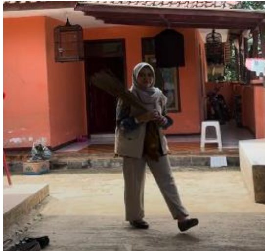
Gambar 6. Pembersihan area luar masjid