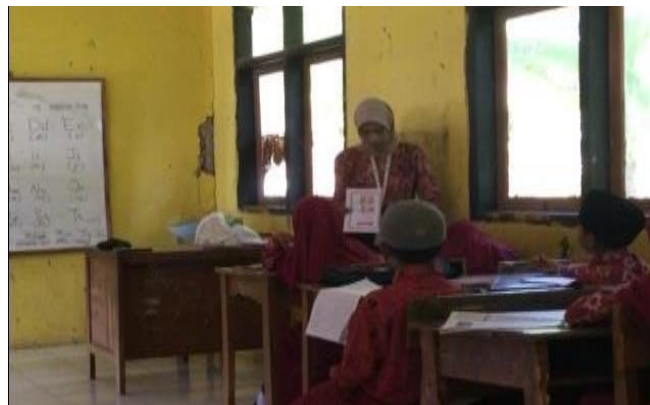
Gambar 4. Pelaksanaan kegiatan belajar mengajar dengan menggunakan metode SCL dan media pembelajaran Flash Card

Pembelajaran menggunakan flash card adalah aktivitas yang memanfaatkan kartu bergambar yang bervariasi sebagai media pembelajaran, yang menyesuaikan dengan materi pelajaran. Tujuan dari pembelajaran menggunakan media ini adalah untuk melatih kecepatan berpikir peserta didik. Dalam kegiatan pembelajaran ini, peserta didik akan diberikan gambar, kemudian mereka harus menyebutkan nama gambar tersebut. Setelah itu, mahasiswa akan memberitahukan nama gambar tersebut dalam bahasa Inggris. Peserta didik diharapkan untuk menghafal nama gambar dalam bahasa Inggris karena pada akhir pembelajaran, biasanya akan ada sesi tanya jawab untuk menguji pemahaman mereka. Penerapan media flashcard dan metode belajar sambil bermain ini, menunjukkan hasil yang positif bagi perkembangan peserta didik, terlihat dari antusiasme dan keterlibatan mereka selama kegiatan berlangsung.