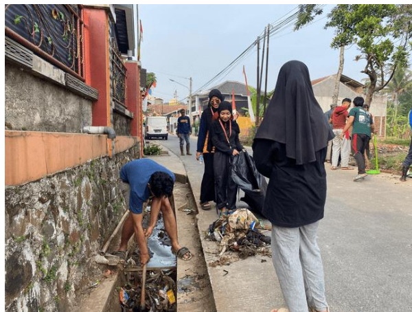
Gambar. 4 Kerja Bakti Bersama Masyarakat

Program pemasangan plang sampah ini diawali dengan kerja bakti bersama masyarakat untuk membersihkan sampah yang ada diselokan. Hal ini dikarenakan terdapat banyak sekali sampah yang menyumbat air selokan sehingga hal tersebut dapat menimbulkan masalah banjir ketika musim hujan.