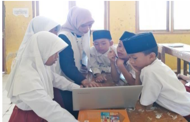
Gambar 5. Pelaksanaan kegiatan belajar mengajar menggunakan metode SCL dan media pembelajaran berbasis teknologi

Sebelum adanya penerjunan mahasiswa, peserta didik di MIS Miftahul Huda tidak familiar dengan teknologi. Meskipun mereka tahu tentang laptop, mereka belum pernah memanfaatkannya secara praktis. Banyak guru juga belum menguasai Teknologi Informasi. Oleh karena itu, mahasiswa memiliki peluang untuk memberikan pengetahuan tentang adaptasi teknologi kepada siswa. Mahasiswa menerapkan teknologi dalam kegiatan pembelajaran ini, yaitu menggunakan laptop dengan menyiapkan media pembelajaran seperti video pembelajaran dan PowerPoint yang menampilkan gambar, teks, dan audio visual sehingga siswa tidak cepat bosan dalam memahami materi.