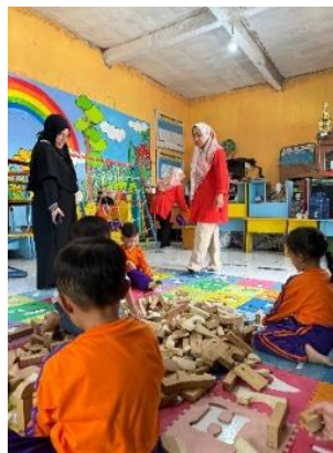
Gambar 3 Motorik halus

Kegiatan terapi juga menjadi bagian penting, dengan mengembangkan dan melaksanakan program terapi fisik yang disesuaikan dengan kebutuhan setiap anak, termasuk latihan terapi fisik atau terapi okupasi, serta penggunaan alat dan perlengkapan khusus seperti bola terapi dan alat bantu koordinasi. Permainan edukasi juga dapat dirancang dan diterapkan untuk meningkatkan keterampilan motorik, seperti permainan yang melibatkan gerakan fisik, manipulasi objek, atau aktivitas kreatif seperti melukis atau membuat kerajinan. Kegiatan kelompok yang mendorong interaksi sosial dan kerja sama sambil mengembangkan keterampilan motorik juga sangat bermanfaat.