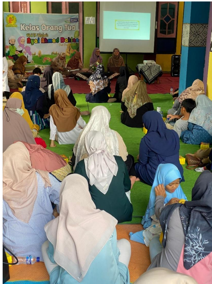
Gambar 1. Edukasi Disiplin Positif