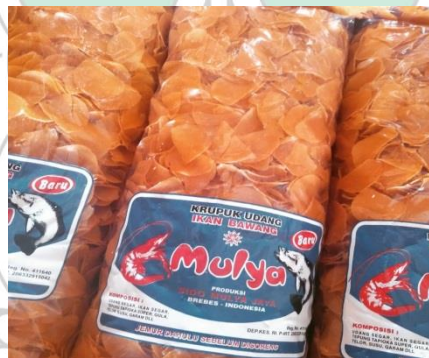
Gambar 2 : Kerupuk Ikan Hasil Olahan Tambak