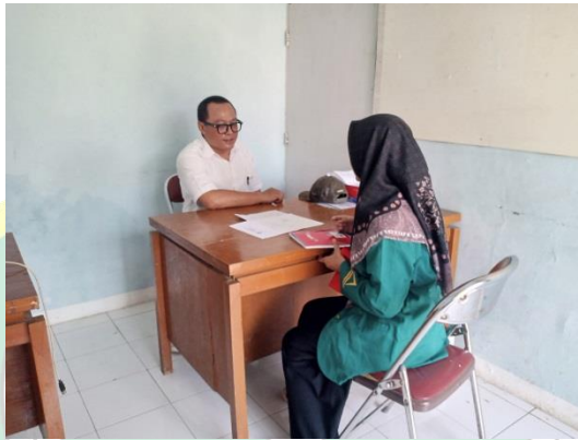
Gambar 1. Wawancara dengan kepala desa Sawoajar