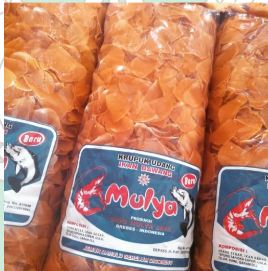
Gambar 8. Kerupuk udang ikan bawang, olahan hasil tambak