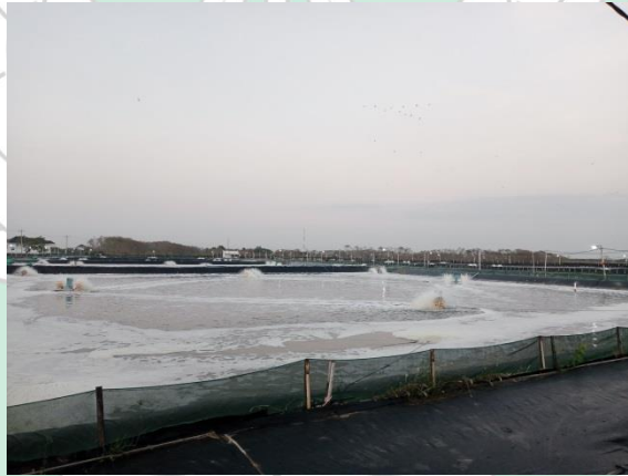
Gambar 5. Tambak yang sudah menggunakan teknologi modern