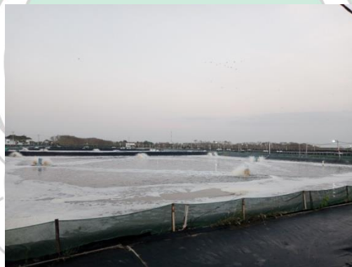
Sumber: Data Dokumentasi Peneliti Tahun 2024