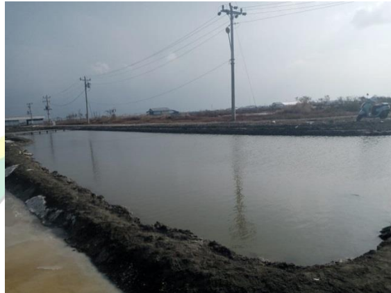
Gambar 7. Tambak Desa Sawojajar