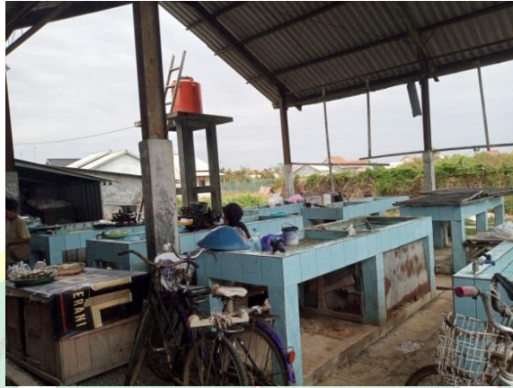
Gambar 4. Tempat penjualan di pasar lokal