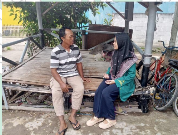
Gambar 2. Wawancara dengan ketua komunitas tambak