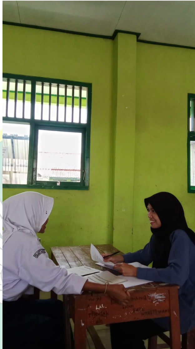
Foto Wawancara dengan Murid Kelas VII