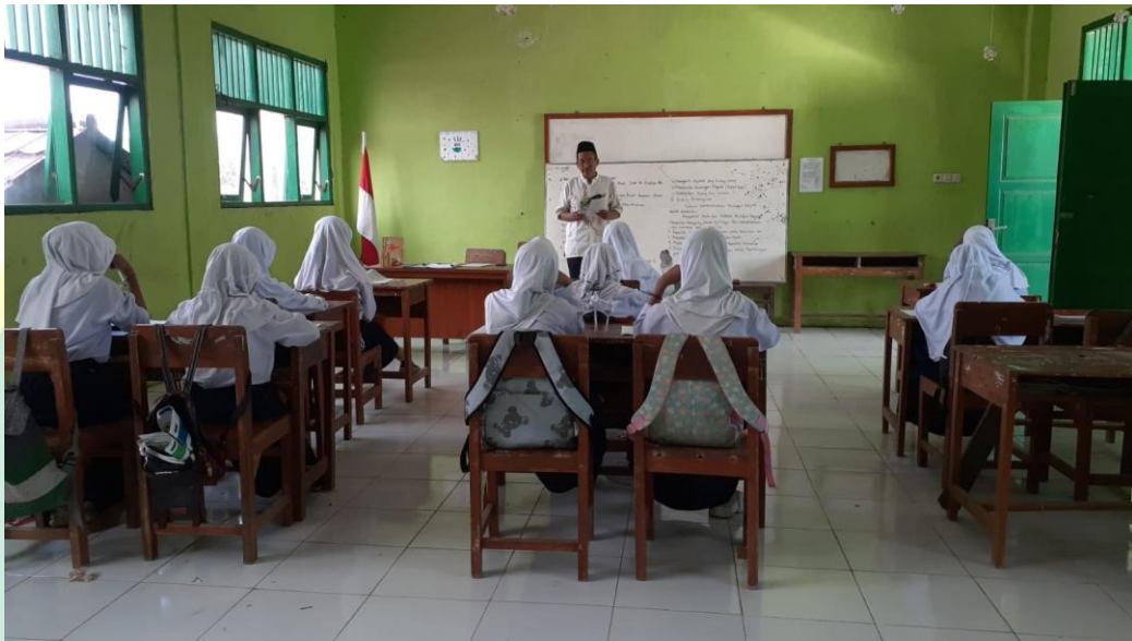
Foto pembelajaran di kelas VII