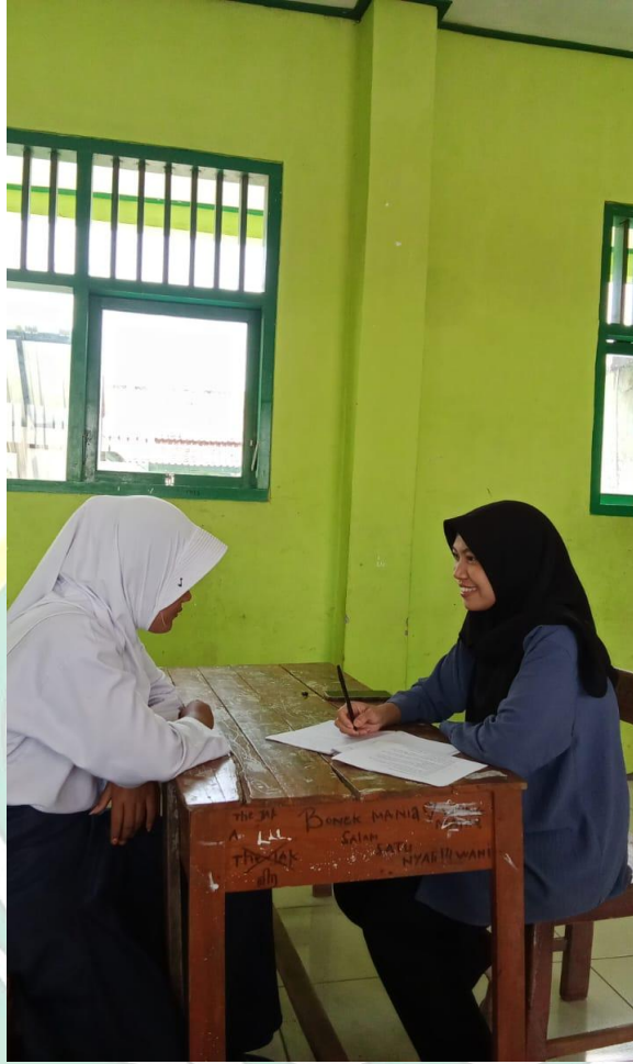
الصورة ٤,٣ المقابلة مع الطالبة

ومن نتائج هذه المقابلة يمكن أن نستنتج أن هذا البحث يوضح أن الأساليب التي يطبقها المعلمون في الفصل الدراسي عند التدريس تتوافق مع الأساليب المخططة. تساعد هذه الطريقة الطلاب حقًا في تلقي الدروس وتجذب اهتمام الطلاب بفهم مادة الدرس بشكل أفضل. بالرغم من أن هناك بعض الطلاب يشعرون بالملل لأن المعلم يستخدم أساليب متكررة في تدريس اللغة العربية حتى لا يهتم الطلاب بالدرس.