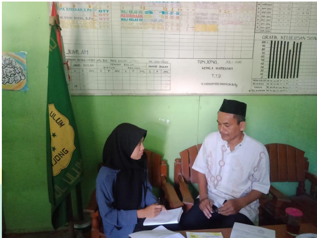
Foto wawancara bersama guru bahasa arab