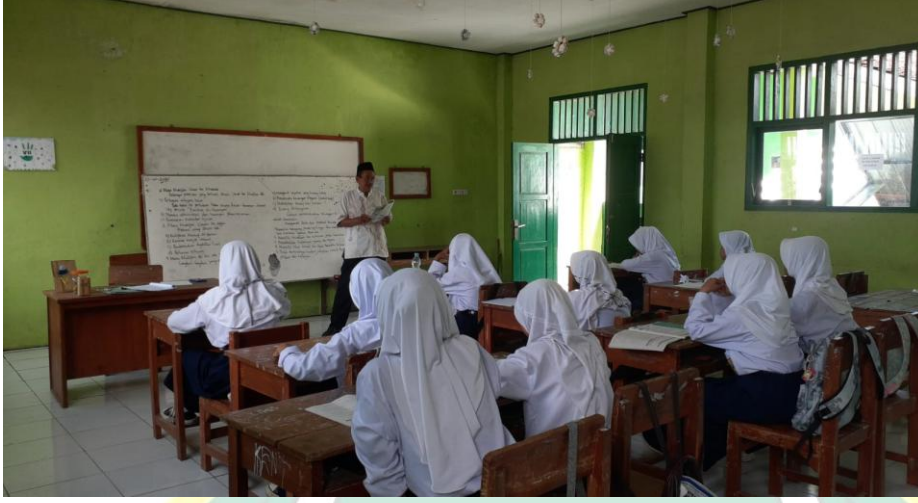
الصورة ٤,١ فتح التعليم

الأشياء التي يتم القيام بها في الأنشطة الأولية هي تكييف الطلاب أو جاهزية الطلاب نفسياً وجسدياً، وإلقاء السلام والدعاء بقيادة رئيس الفصل، وتسجيل حضور الطلاب من خلال ذكر واحد تلو الآخر وهذا يعطي انطباعاً عن المعلم موقف رعاية تجاه الطلاب، ثم اطرح على الفور الأسئلة المتعلقة بالمواد الموجودة في الاجتماع السابق وما سيتم دراسته، بعد ذلك ينقل أهداف التعليم التي سيتم تحقيقها ثم يقوم الأستاذ العربي بتحفيز الطلاب.