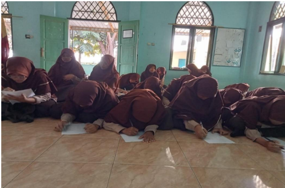
FOTO PENELITIAN TES BAHASA ARAB