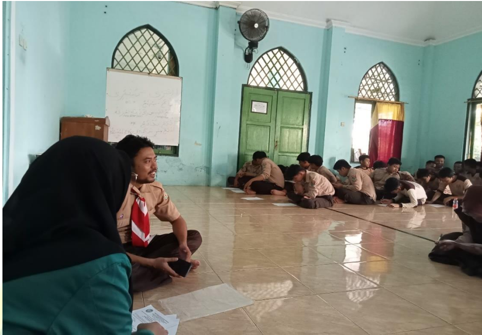
FOTO WAWANCARA DENGAN GURU BAHASA ARAB