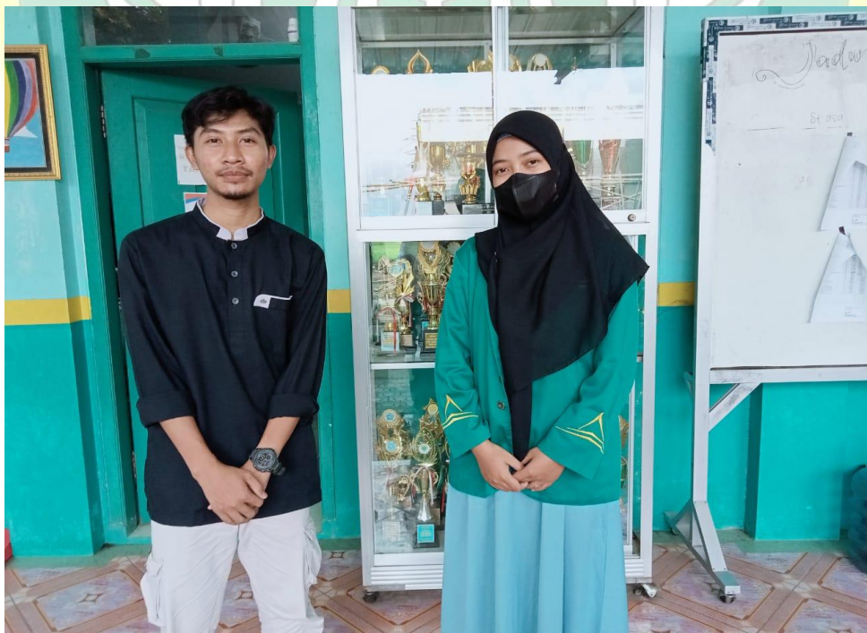
FOTO WAWANCARA DENGAN KEPALA KESEKRETARIATAN