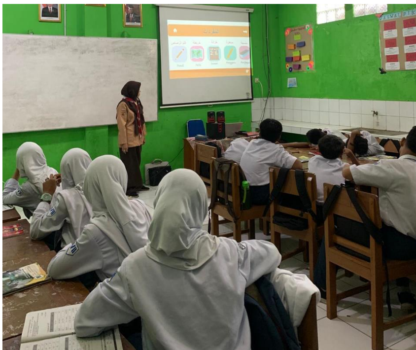
Kegiatan belajar mengajar bahasa arab dikelas VII C menggunakan video interaktif pembelajaran