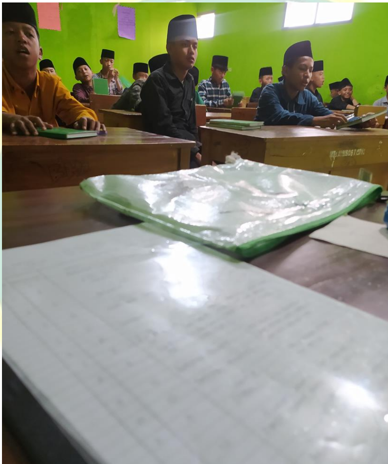
Melakukan pengulangan materi (review) semasa pembelajaran

العربية الإنجليزية) بمعهد الإحسان بيحي على طلابهم هو تكرار التعليم على المواد التي يعتبرها الطلاب ضعيفة، وتقييم الطلاب كتابة وكتابة لتحسين نتائج التعليم التي ستتم مقارنتها لاحقا بنتائج التعليم السابقة.