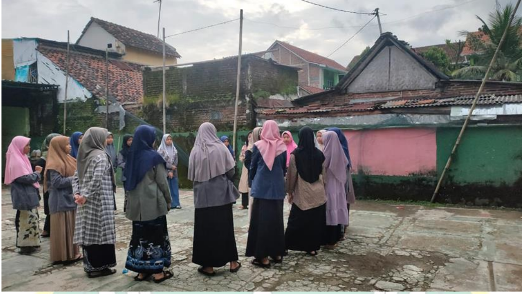
Program AEDS melakukan pembelajaran diluar kelas saat kelas sore