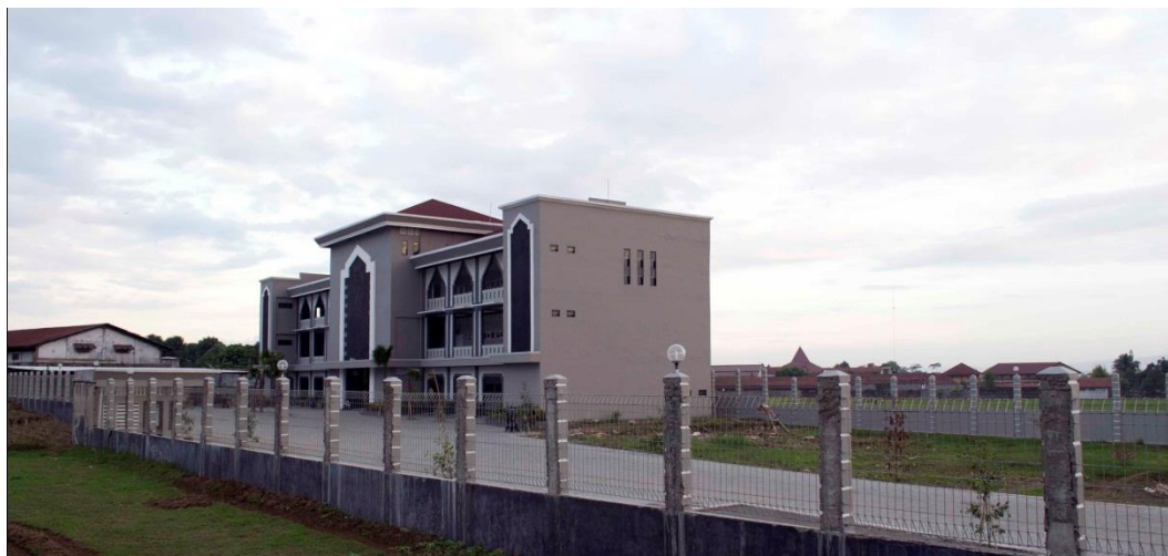
Foto 5. Gedung SMA Islam Teladan Al Irsyad Al Islamiyyah Purwokerto

a. Alamat : Jalan Alun-alun Nomor 02 Purwokerto, Telp. (0281) 636900