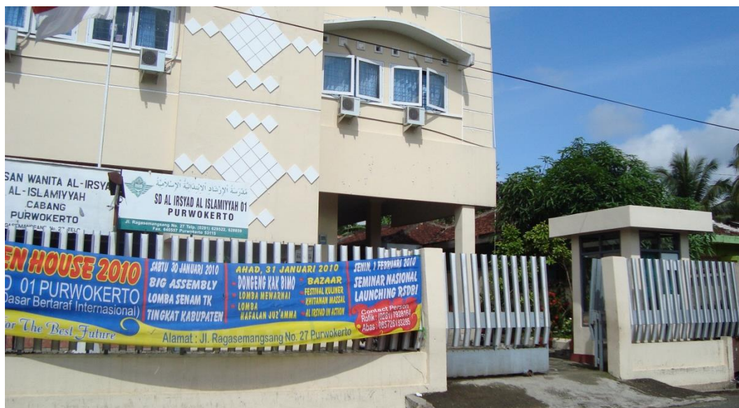
Foto 2. Gedung SD Al Irsyad Al Islamiyyah 01 Purwokerto lokal utara