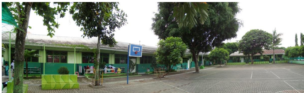
Foto 3. Gedung SD Al Irsyad Al Islamiyyah 02 Purwokerto lokal utara