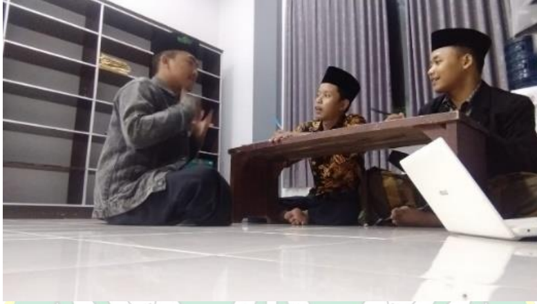
الصورة المقابلة مع الطلاب

2. مزايا والعيوب من استخدام البطاقة الملونة لتسهيل حفظ المفردات لطلاب