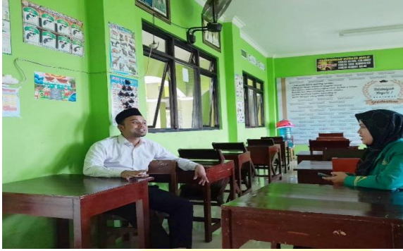
الصورة ١. المقابلة مع مدرس اللغة العربية