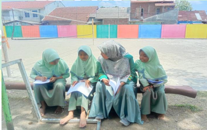
المقابلة مع الطلاب