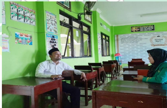
المقابلة مع مدرس اللغة العربية