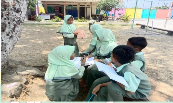
الصورة ٤. الملاحظة في الفصل الثالث أبو بكر

ومن هذا البيان يستنتج المؤلف أن أساليب التعلم مهمة جداً لتحقيق أهداف التعلم، لذلك يجب أن تكون مبدعاً وذكياً في اختيار الأساليب المناسبة والفعالة حتى يتمكن الطلاب من فهم الدروس التي يقدمها المعلم.