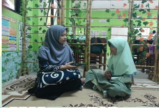
الصورة ٧. المقابلة مع طالبة فصل الثالث ابو بكر

التي حصل عليها المؤلف في الميدان أثناء البحث في المدرسة الابتدائية الإسلامية الحكومية ١ بانيوماس ، أما عن مزايا وعيوب طريقة التعليم والعلم السياقي .