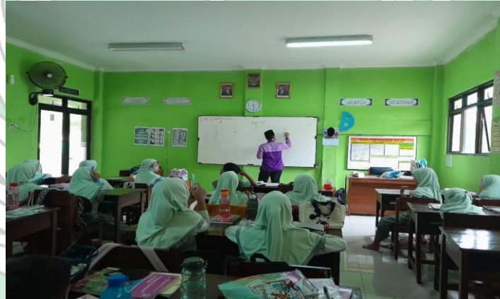
الملاحظة في الفصل الثالث ابوبكر