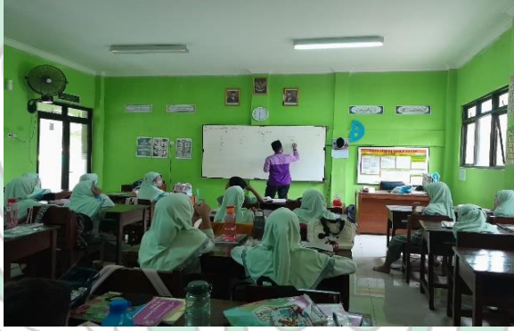
الصورة ٥. الملاحظة في الفصل الثالث أبو بكر

وجدت أعدادًا مختلفة من الحيوانات. وجد الفرقة ٣ أكبر عدد من الحيوانات من المجموعات الأخرى، أي ٢٣ حيوانًا، بينما أقلها كان الفرقة ٢ بـ ١٦ حيوانًا. وبعد ذلك، وبما أن الوقت قد انتهى والاستعداد لصلاة الظهر في الجماعة، فإن مناقشة أسماء الحيوانات التي تم العثور عليها ستستمر الأسبوع المقبل، أي أن المعلم سيعطي المفردات لكل مجموعة ثم كل مجموعة. يجب على المجموعة أن تحفظها مفردات أكبر عدد من الحيوانات التي تم العثور عليها من قبل كل مجموعة. ٦٤