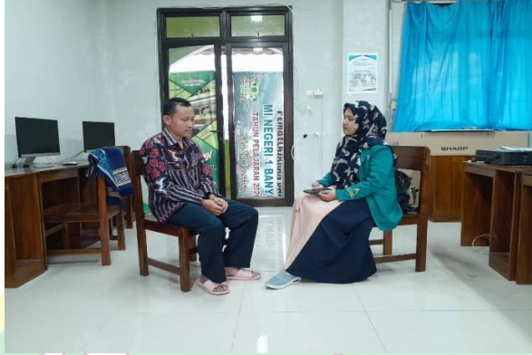
الصورة ٢. القابلة مع واكل المنهج

ولكن الطلاب أكثر انخراطاً في التعلم وأكثر حرية وانتقاداً في هضم المواد التي تتم مناقشتها حتى يتمكنوا من فهم أكثر بشكل أفضل وتذكر دائماً ما تعلمته". ٦١