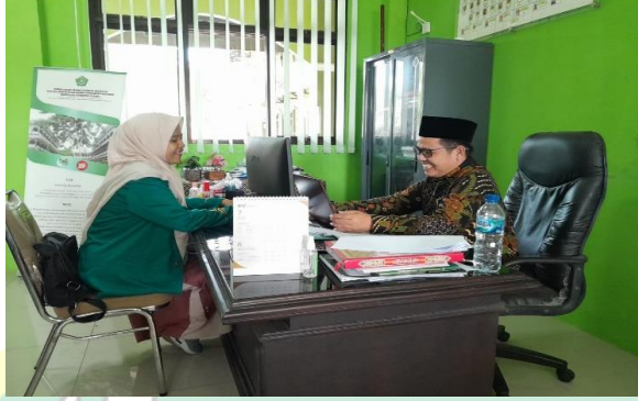
الصورة ٣. المقابلة مع رئيس المدرسة

النموذج السياقي يمكن أن يكون أسهل لأن طفلاً واحداً يمكنه نقله أو نطقه بسهولة أكبر. أعتقد أن التعليم والتعلم السياقي فعال للغاية". ٦٢