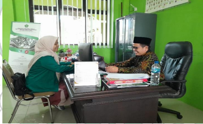
المقابلة مع رئيس المدرسة