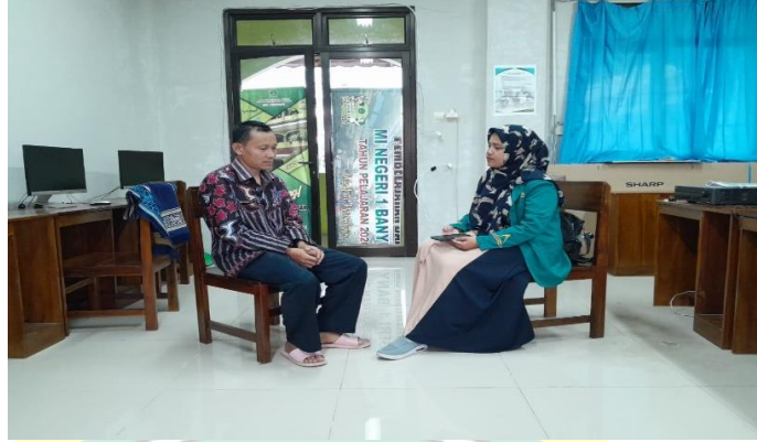
المقابلة مع واكل المنهج