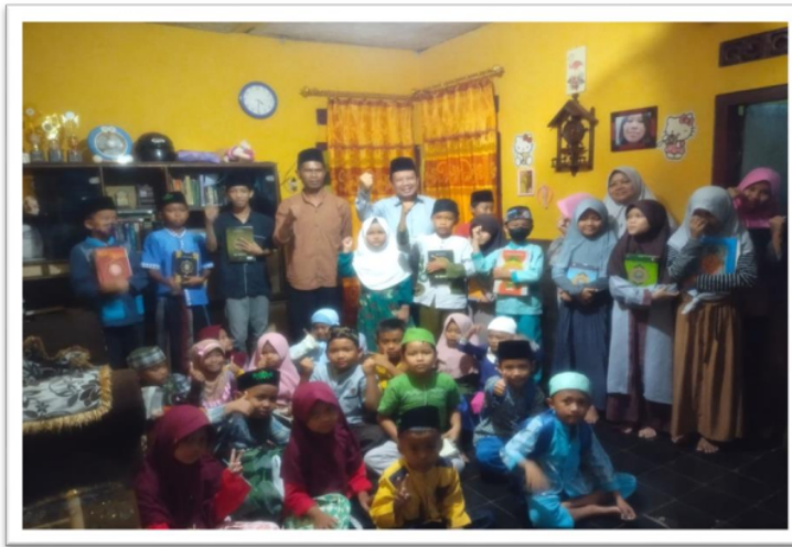
Gambar.5 Usai workshop Edukasi Al Qur'an bersama santri TPQ Sahabat Qur'an