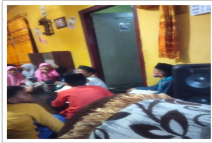
Gambar. 15 Aktifitas santri TPQ Sahabat Qur'an dalam setoran Hafalan Qur'an

Jumlah santri 150 santri terbagi menjadi shift pembelajaran sore jam 16:00 dan shift pembelajaran malam jam 19: 00