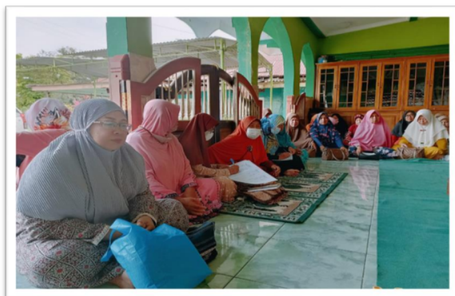
Gambar. 11 Peserta Workshop Manajemen TPQ dari para pengelola TPQ , Ustadazh, Fatayat, Muslimat