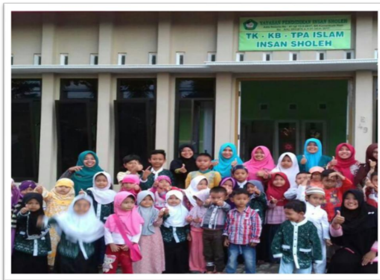
Gambar. 19 Para santri TPQ Insan Sholeh setelah proses pembelajaran

Jumlah santri 50 santri terbagi terdiri dari usia TK dan SD, pembelajaran sore jam 16:00-17:30 Wib. Pembelajaran meliputi Baca Tulis Al Qur'an, Fiqh, Akhlak , Tarikh dan hafalan QS Pendek / Juz 'Ama . Pembelajaran senin – jumat, sabtu dan minggu libur.