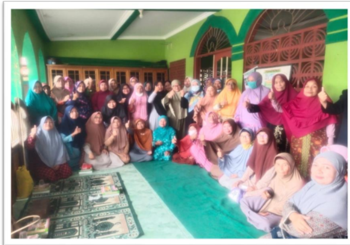
Gambar. 13 Peserta Workshop Manajemen TPQ dari para pengelola TPQ , Ustadazh, Fatayat, Muslimat di Masjid Al Baqi Sadat