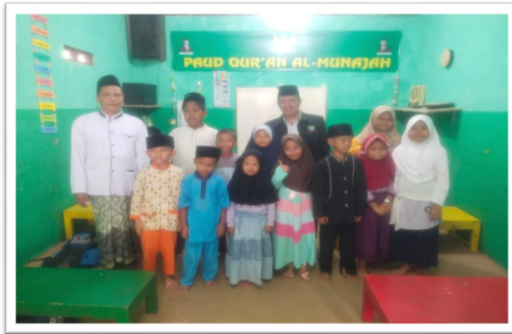
Gambar. 20 Para santri TPQ Al Munajah setelah proses pembelajaran