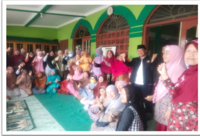
Gambar. 12 Para Peserta Workshop Manajemen TPQ dari para pengelola TPQ , Ustadazh, Fatayat, Muslimat setelah usai workshop