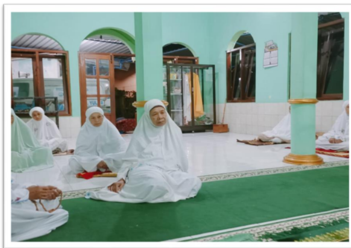
Gambar. 14 Peserta Workshop Manajemen TPQ dari para pengelola TPQ , Ustadzh, Fatayat, Muslimat di Masjid Al Hikmah