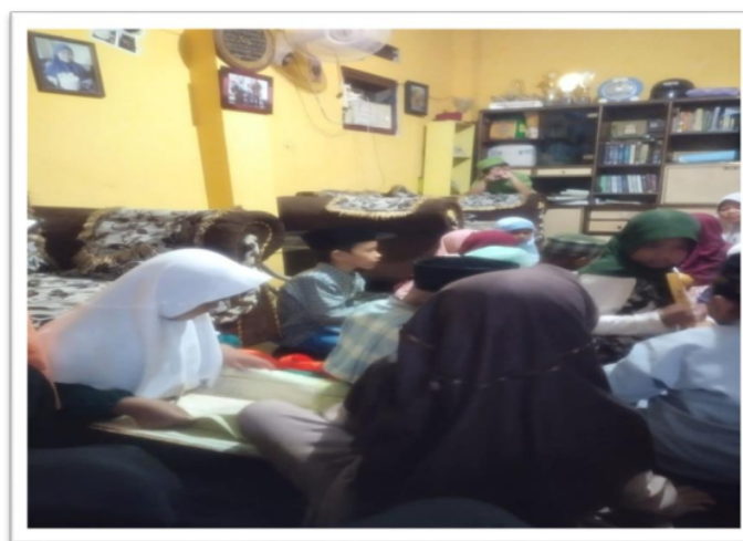
Gambar. 18 Pembelajaran imla santri TPQ Sahabat Qur'an