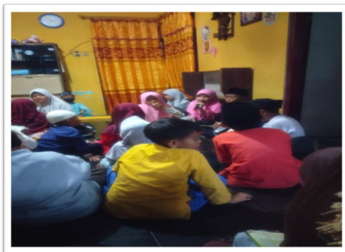
Gambar. 17 Semaan Al Qur'an 4 juz santri TPQ Sahabat Qur'an