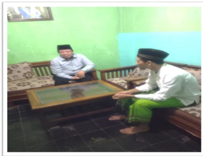
Gambar. 7 Mapping Program Workshop Manajemen TPQ