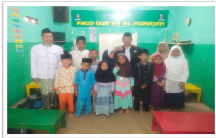
Gambar. 21 Para santri TPQ Al Munajah setelah lomba Hafalan Quran surat-surat pendek