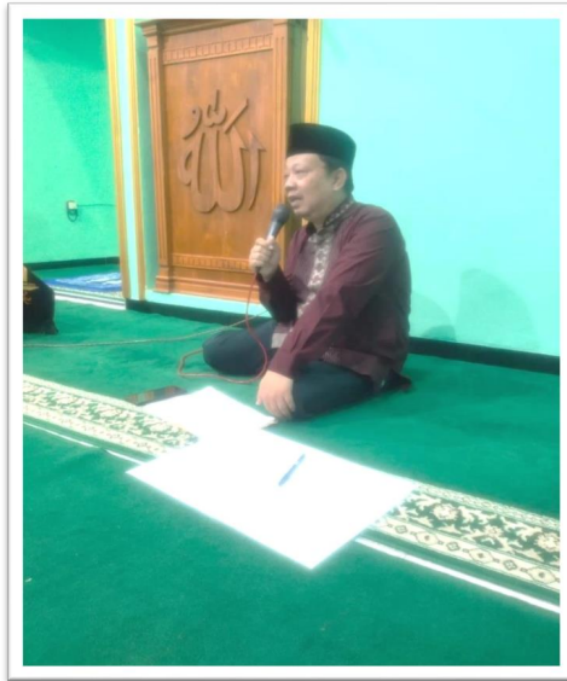
Gambar. 1 Ketua Tim Edukasi AL Qur'an sedang membuka acara workshop Edukasi Al Quran