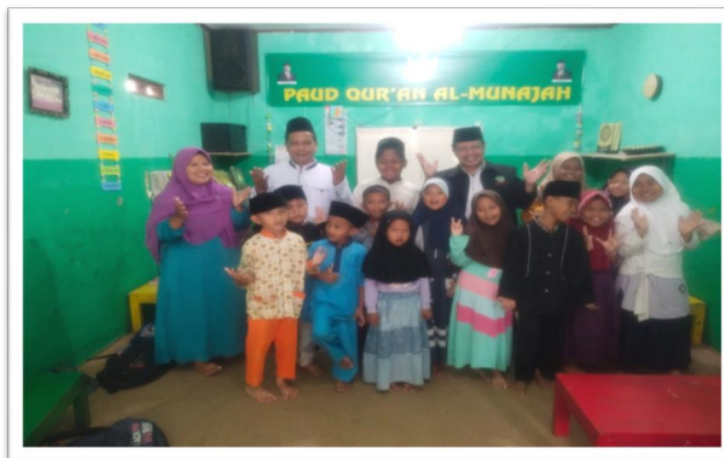
Gambar.6 Usai workshop Edukasi Al Qur'an bersama santri TPQ Al Munajah