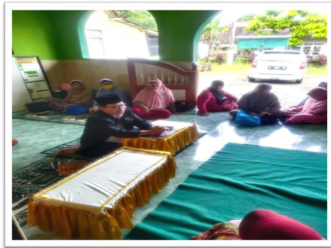
Gambar. 8 Pembukaan Workshop Manajemen TPQ oleh ketua Tim Pengabdian