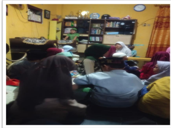
Gambar. 16 Aktifitas Pembelajaran santri TPQ Sahabat Qur'an