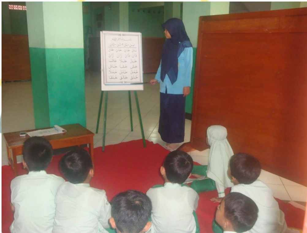
Kegiatan Penanaman Konsep