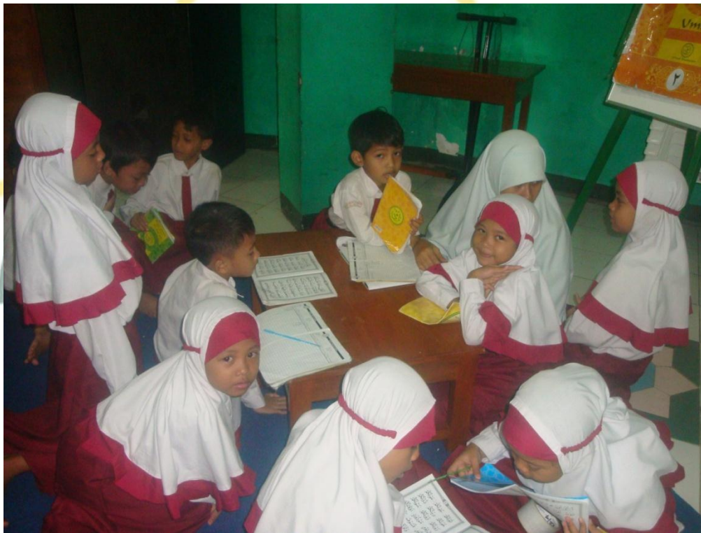
Kegiatan Membaca Bersama-sama