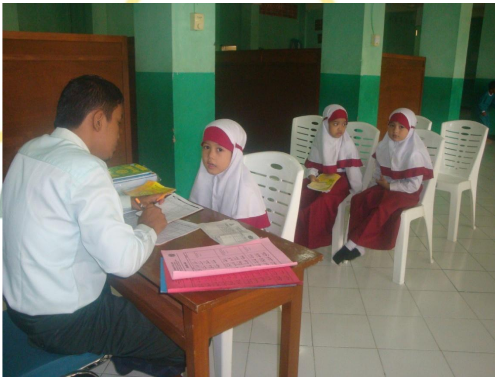
Kegiatan Evaluasi Kenaikan Tingkat