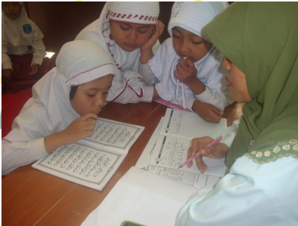
Kegiatan Evaluasi Individual