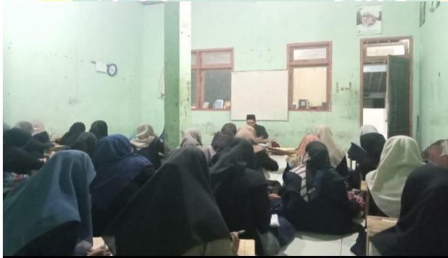
(عملية تعليمية الإعلال في الملاحظة الثاني)

بعد أن يشرح المعلم الإجابة من أحد الطلاب، ثم الأستاذ يعطى تنبيه أو ملاحظة يجب على الطلاب تذكرها " تنبيه لكم جميعا ما يجبون تذكرهم انما تحذف واو المفعول من الأجواف عند سيبويه لأنها زائدة وهي أولى بالحذف من الأصل وهو عين الكلمة واما عند الأحفش فتحذف الواو التي هي عين الكلمة لأن واو المفعول علامة والعلامة لا تحذف لفوات المقصود بحذفها وجوابه ان محل ذلك إذا لم توجد علامة أخرى وقد وجدت هنا علامة أخرى وهي الميم". ثم يسأل المعلم عن الشرح وتنبيه الذي أوضحه المعلم ثم عندما يفهم جميع الطلاب، ثم ختم الأستاذ على الأنشطة التعليم بقراء الحمدلة والدعاء كفاية المجلس معا ثم أستاذ بقراءة التحميد والسلام.