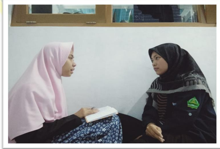
(الوثيقة مع أدي نور الطليبة الفصل الأولي قسم الباء)