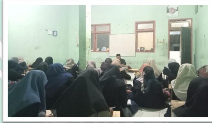
(الملاحظة الثانية في الفصل الأول قسم الباء)