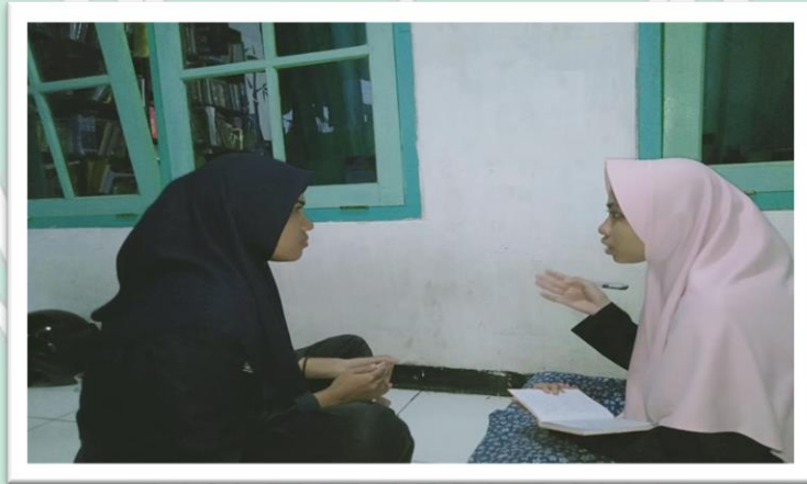
(الوثيقة مع فطري الطليبة الفصل الأولي ب)