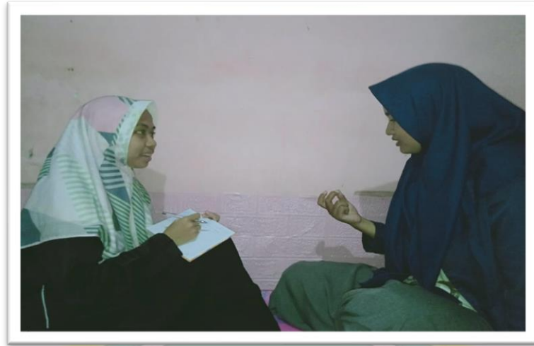
(الوثيقة مع حنيفة الطليبة الفصل الأولى قسم الباء)