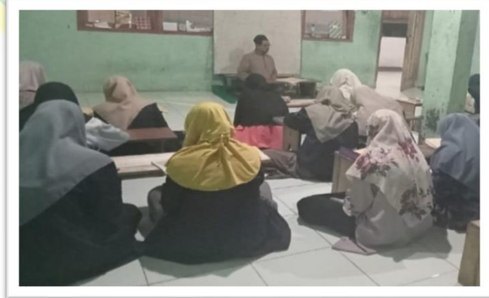
(الملاحظة الثانية في الفصل الأول قسم الباء)