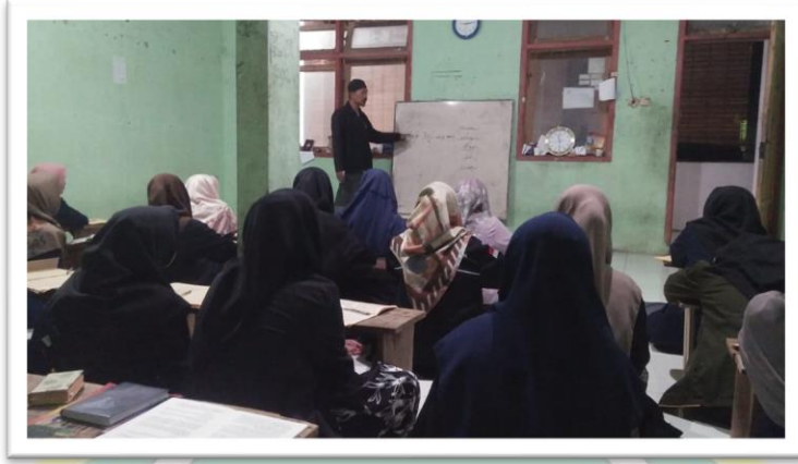
(الملاحظة الأولى في الفصل الأول قسم الباء)