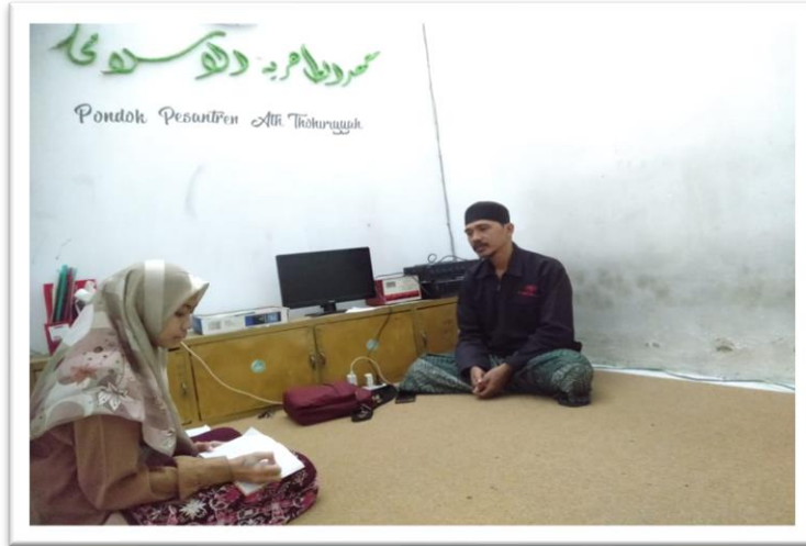
(المقابلة مع المعلم الإعلال في الفصل الأول قسم الباء أستاذ مفيد أدينساة)