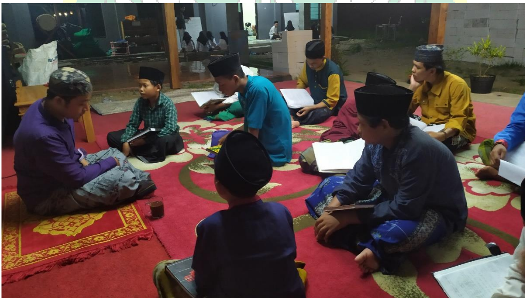
Proses Pembelajaran kitab Al-Ajurumiyyah menggunakan metode Tamrin