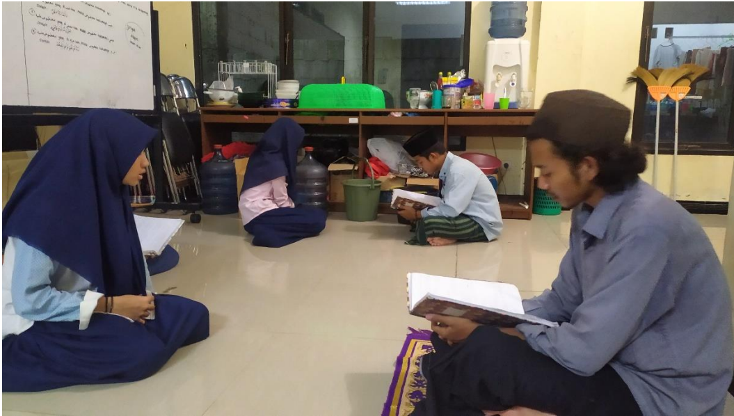
Proses Pembelajaran kitab Al-Ajurumiyyah menggunakan metode Khifidz