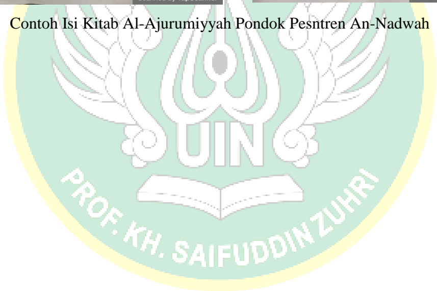
Contoh Isi Kitab Al-Ajurumiyah Pondok Pesantren An-Nadwah

KITABANJARAN (Pembahasan) 1. Kumpulan kata-kata yang diawali dengan huruf kapital Contoh: (Aptiga) (Aptiga) (Aptiga) (Aptiga) 2. Kumpulan kata-kata yang diawali dengan huruf kapital Contoh: (Aptiga) (Aptiga) (Aptiga) (Aptiga)