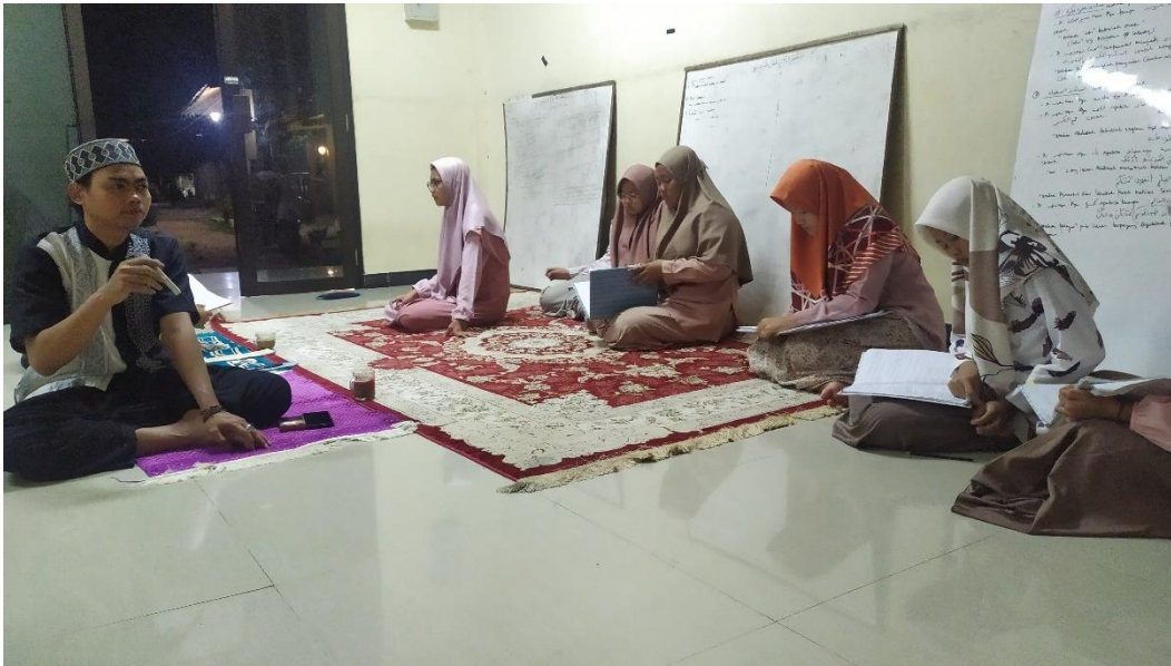
Proses Pembelajaran kitab Al-Ajrumiyyah menggunakan metode ta'lim