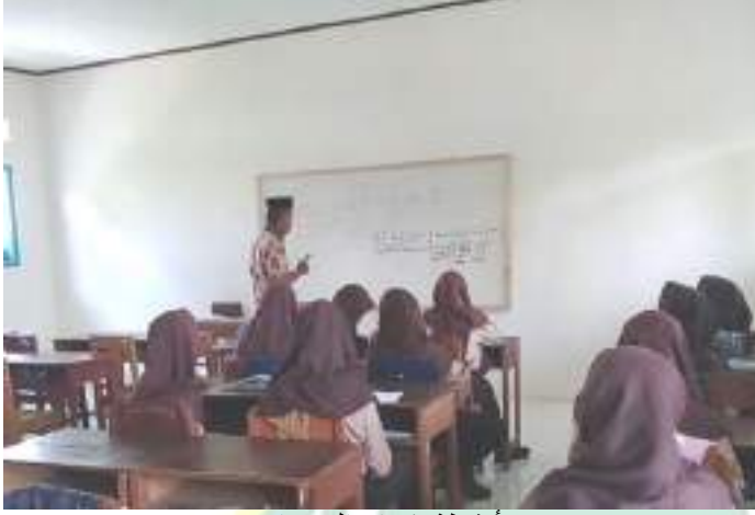
أنشطة تكرار المفردات

فسيقوم المعلم بتبرير ثم توجيه الطلاب لتكرار الكلمة مرارا وتكرارا حتى يتم تصحيحها.