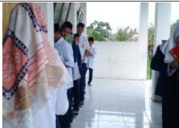
Kegiatan berbaris di depan kelas menunggu giliran menyetorkan Kosa kata Siswa kelas VII MTs Yabakii Nuril 'Ibad Gentasari Kroya