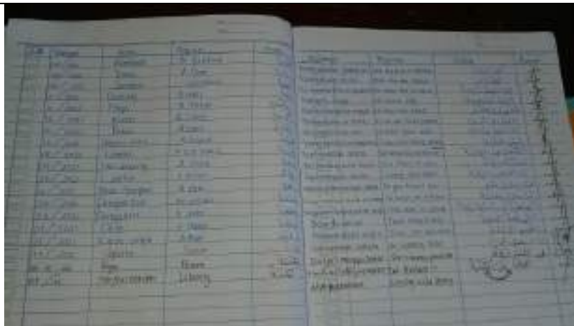
Dokumentasi salah satu catatan One Day One Word siswa MTs Yabakii Nuril 'Ibad Gentasari Kroya