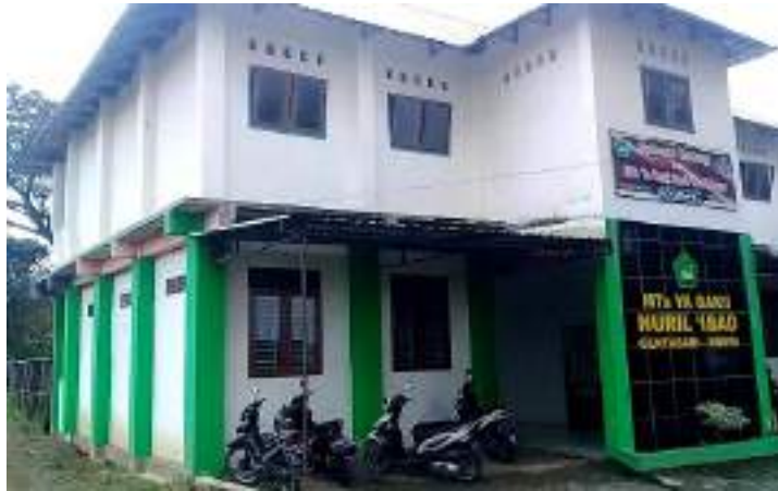
MTs Yabakii Nuril 'Ibad Gentasari Kroya