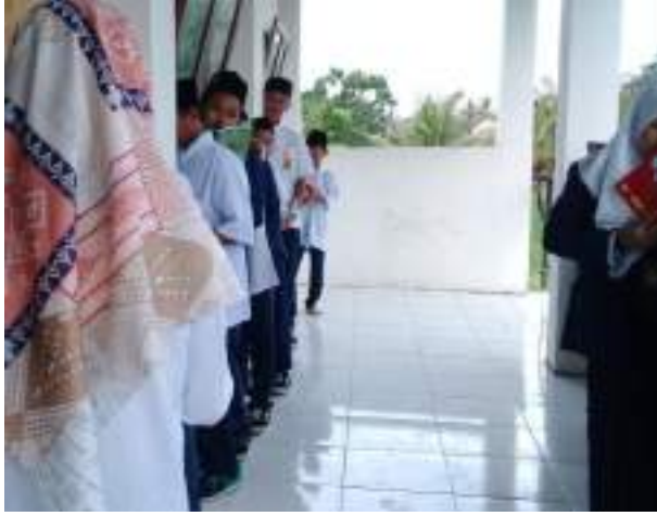
أنشطة إيداع المفردات

قبل إبتدأ الساعة الأولى يعني في الساعة السابعة والرابع، سأقف المعلم أمام الفصل ويوجه الطلاب إلى الاصطفاف أثناء حمل دفاتر المفردات الخاصة بهم. ثم يسلم الطلاب كتبهم للمعلم قبل إيداع المفردات والجمال التي أعطيت بالأمس. إذا انتهى الطلاب من أداء واجباتهم، أعطى المعلم الأحرف الأولى من اسمها في كتاب الطالب. إذا كان هناك طلاب لم يحفظوا، فسيعطي المعلم الفرصة لهؤلاء الطلاب للحفظ في الصف الخلفي حتى يتم حفظهم.