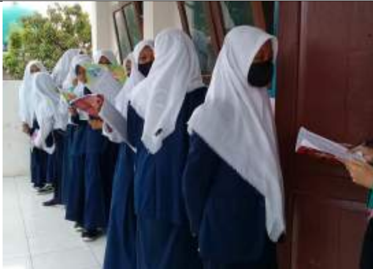
Kegiatan menyetorkan hafalan kosa kata siswa kelas VIII MTs Yabakii Nuril 'Ibad Gentasari Kroya