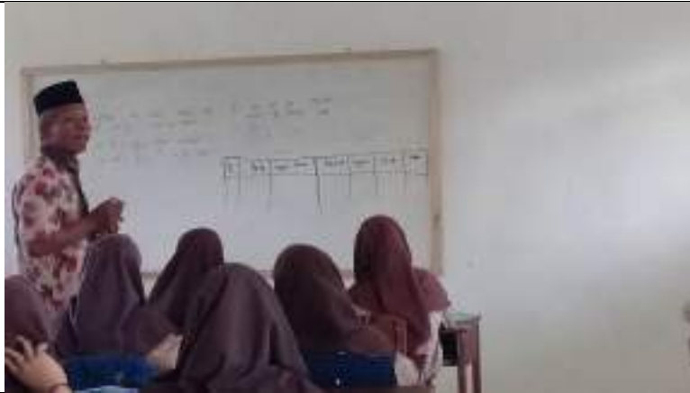
Kegiatan evaluasi program One Day One Word / المفردات اليومية