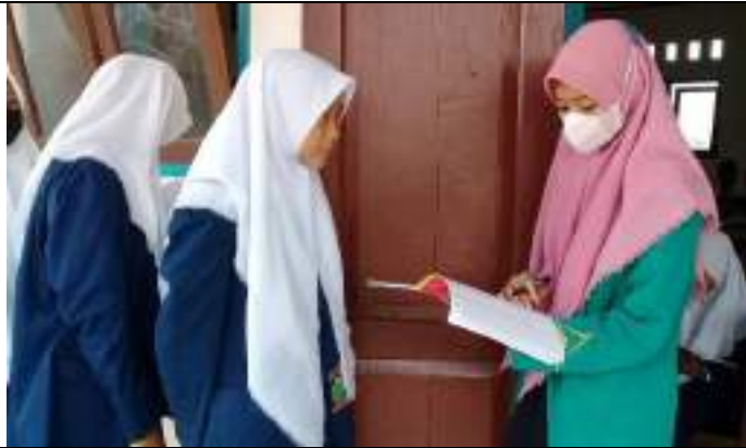
Kegiatan menyetorkan hafalan kosa kata siswa kelas IX MTs Yabakii Nuril 'Ibad Gentasari Kroya 'Ibad Gentasari Kroya