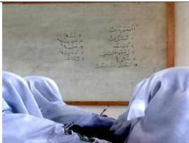
Kegiatan penulisan mufrodats pada program One Day One Word / المفردات اليومية di dalam kelas